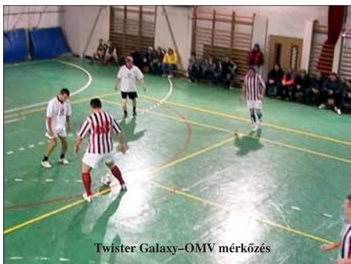
Twister Galaxy–OMV mérkőzés