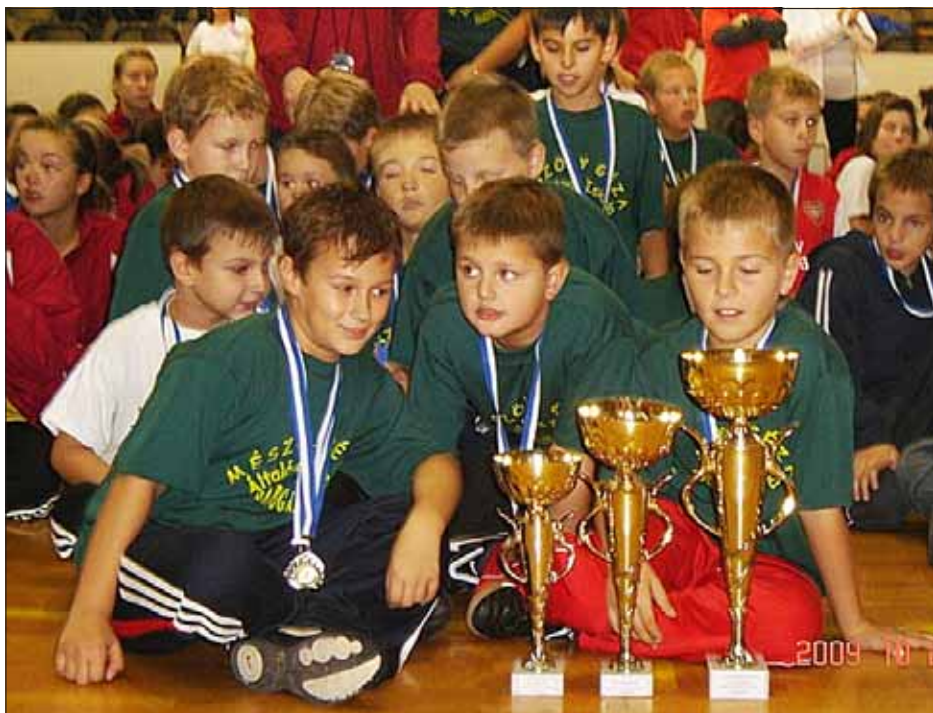
A sárbogárdi gyerekek megint kitétek magukért. Írás a 13. oldalon.