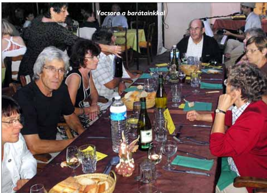
Vacsora a barátainkkal

Először az Eiffel-tornyot néztük meg, majd busszal indultunk a diákok negyedébe, a Quartier Latin-be. Ennek a városrésznek a Sorbonne a központja, s a nyüzsgő egyetemi élet miatt ma is különleges hangulata van. Világhírű műemlékei mellett (Sorbonne, Panthéon, Luxembourg kert) nekünk, magyaroknak is tartogat