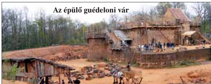
Az épülő guédeloni vár

Április 15-én a francia fővárosba, Párizsba mentünk. Talán mindenki ezt szerette volna a legjobban látni. Párizsban az első állomásunk az Eiffel-torony volt. Élőben még szebb, mint a képeken. A harmadik szintig mentünk fel. Az Eiffel-torony megsodálása után a buszról láthattuk a Champs Elysées-t és a Diadalívet is. Ezek után kaptunk egy kis szabadidőt. Ez alatt az idő alatt a Montmartre-on sétáltunk, vásároltunk, és aki akarta, megnézhet a Sacré-Coeur. Délután ellátogattunk a Notre Dame-hoz, amit kívülről, belülről megnéztünk. Tényleg nagyon szép volt. De az egész napos programok közül az esti program volt a legjobb, amikor hajózáztunk. A hajóról még több mindent láthattunk. A francia járőrelők nagyon aranyosak és kedvesek voltak, mert mi, magyar turisták lelkesen integettünk a hajóról a parton lévőeknek, akik viszonzták üdvözlésünket. Akkor este nagyon későn értünk haza.