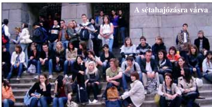
A sétahajózásra várva

Április 13-án gyülekeztünk a gimnázium előtti parkolóban. Mindenki izgatottan várta az indulást. Este 7 órakor érkezett meg a buszunk, bepakoltuk a holmijainkat, elbúcsúztunk szüleinktől és testvéreinktől, és nekivágtunk a nagy útnak. Utazásunk során átmentük Ausztrián és Németországon is, bár Németországból nem sokat láttunk, mert mire odaértünk, besötétedett.