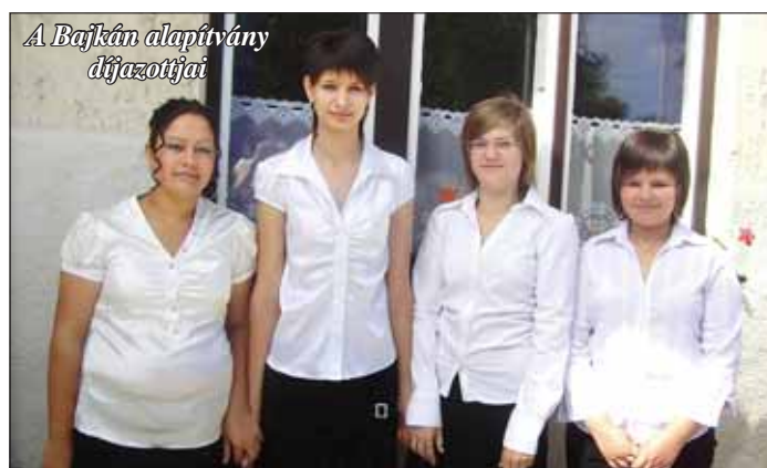
A Bajkán alapítvány díjazottjai