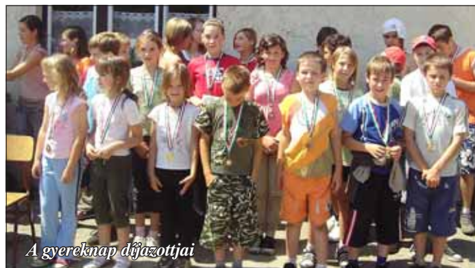
A gyereknapi díjazottjai