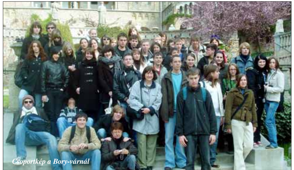
Csoportkép a Bory-várnál

Április 9-én Pécs városát tűztük ki úti célunknak. Itt a tévétornyot, a székesegyházat és a dzsámít néztük meg.