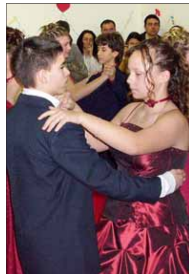
A IV. Béla Általános Iskola 8. osztályos tanulói