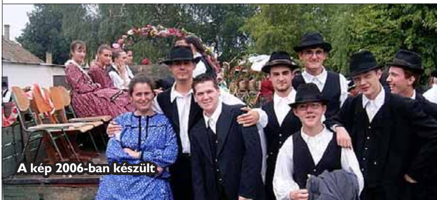
A kép 2006-ban készült

Nagy tisztelettel és szeretettel hívjuk és várjuk községünk minden kedves lakosát az immár hagyományossá vált szüreti felvonulásra, amely