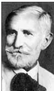
Benedek Elek (1859. 09. 30.- 1929. aug. 17.)

Kérjük az intézmények vezetőit, tegyék lehetővé, hogy ezen a napon minden gyerek legalább egy népmesét tarisznyájába (iskolatáskájába) tehessen, hiszen egy megfelelő pillanatban megkapott mese olykor egész életünkre kihat.