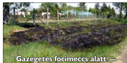
Gazégetés focimeccs alatt —

Légión 2000—Magnum 3-5 Toledo 2005—Vidámfiúk 5-4 III. helyért: Vidámfiúk—Légión 2000 0-5