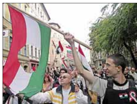
A fotók 2006. október 23-án készültek Budapesten

kot, aztán hazamegy ebédelni vagy az ünnepség időpontjától függően vacsorázni, az méltósággal ünnepel, s akár Rákóczi fejedelem méltó utódjának érezheti magát. És másnap az újságban olvashatja, hogy a magyar nép méltósággal ünnepel. Jó érzés, büszkeség tölti őt el. És mi tagadás, abban reménykedünk, hogy ez lesz. Nem az ordításokról, narancsdobálásokról van itt már régen szó! Az csak a felszín. A lényeg a szónok és a hallgató lelke mélyén játszódik le titkosan. Méltósággal?