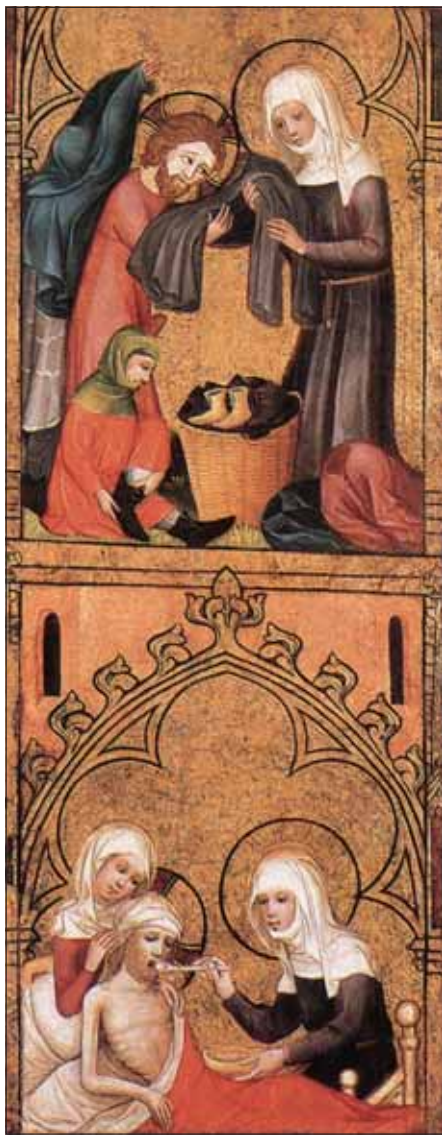
Szent Erzsébet ruhát ad a szegényeknek és beteget ápol (ismeretlen német mester műve)

Ezzel kezdődött Erzsébet kálváriája. Miután az udvar eltávolította Wartburgból, ott kerestett továbbvezető utat, ami egész életében vonzotta: kortársa, Assisi Ferenc szegénységben és a korabeli vallásos megújulás szerint Krisztus odaadó, áldozatos követésében. Oltalmat és támogatást először rokonságától kapott, akik politikai előnyök reményében meg akarták házasítani II. Frigyes császárral. Magyarországra nem akart visszatérni, talán azért is mindössze egyszer járt itt újra: férjével nászúton. Végül a pápa vette védelmébe, s lelki vezetője, Konrád gondjaira bízva 1229-ben Marburgban telepedett le, és alapította meg messze földön híres ispotályát, ahol a szegényeket és betegeket ápolta 1231-ben történt haláláig. Nyu-