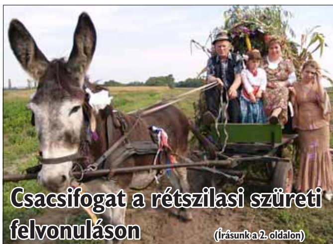
Csacsifogat a rétszilasi szüreti felvonuláson (Írásunk a 2. oldalon)