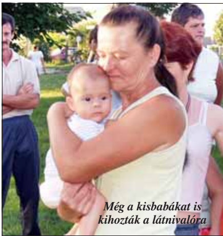
Még a kisbabákat is kihozták a látnivalóra