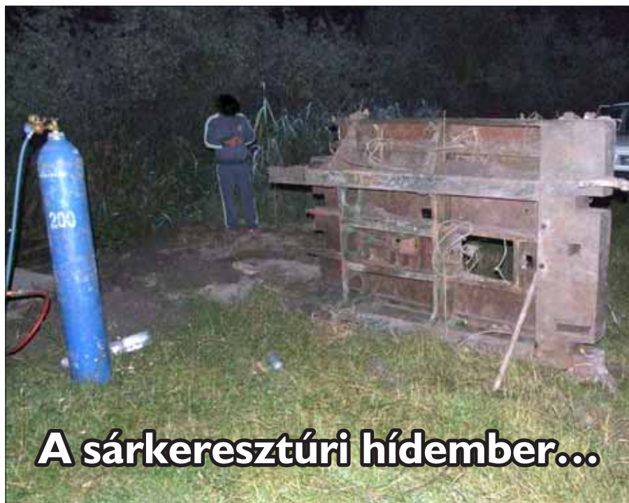
A sárkeresztúri hídember...