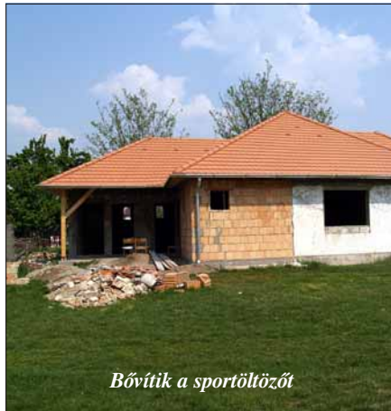
Bővítik a sportöltözőt