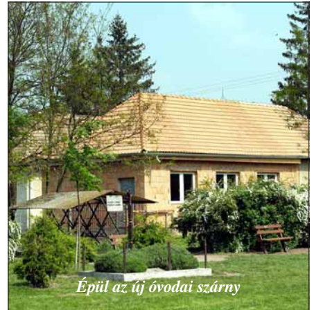
Épül az új óvodai szárny