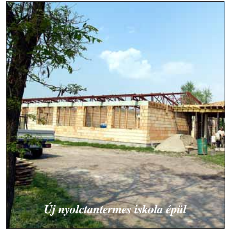
Új nyolctantermes iskola épül

megfelelő feltételeket kialakította, így most ott üzemel a bolt.