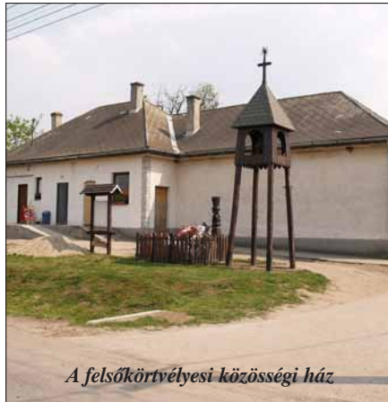
A felsőkörtvélyesi közösségi ház

— Úgy gondoltuk, nem maradhatnak bolt nélkül az ott élő emberek. A közösségi ház három helyiségét odaadtuk egy vállalkozónak, aki felújította azokat, a működtetéshez szükséges, előírásoknak