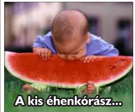
A kis éhenkórász...

Gratulálunk! Nyereményed átveheted a szerkesztőségben.