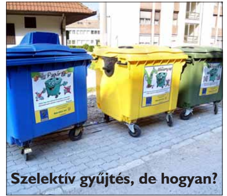
Szelektív gyűjtés, de hogyan?

Egyik olvasónk elmondta, hogy a napokban tájékoztatták azokat a földtulajdonosokat, akiknek a földjeit érinti majd az elkerülő út megépítése, hogy valószínűleg pénzhány miatt az utat felüljárók nélkül építik majd meg. Vannak, akiknek a földjét kettévágja az út. Azt kérdezik a földtulajdonosok, hogyan tudnak majd átmenni a gépeikkel a száguldó autók között az út egyik oldaláról a másikra?