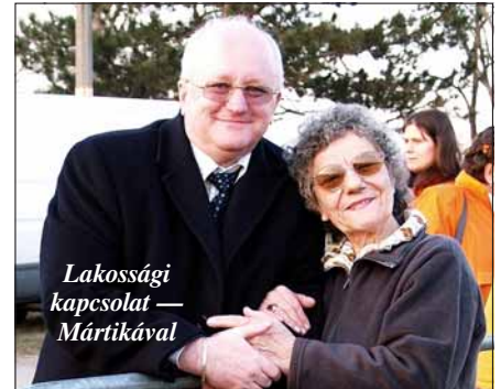
Lakossági kapcsolat — Mártikával

Azután valakinek jött egy mentő ötlete, hogy mivel a 17 képviselőből csak Fe-