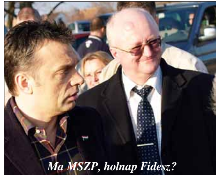
Ma MSZP, holnap Fidesz?

— Éppen ezért magyaráztam a Nedoba Károly vezette MSZP-frakcióban, hogy a 210 millió forintos hitelkeretünkkel 2005. december 31-én már 161 millió fo-