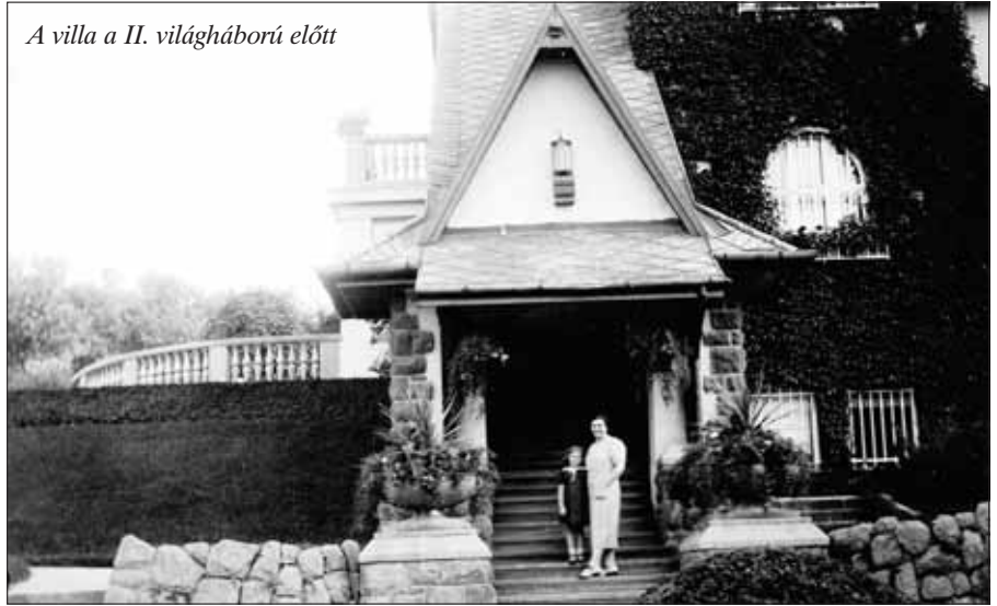
A villa a II. világháború előtt