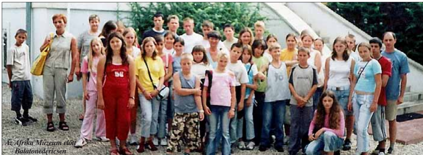
Az Afrika Múzeum előtt Balatonedericsen