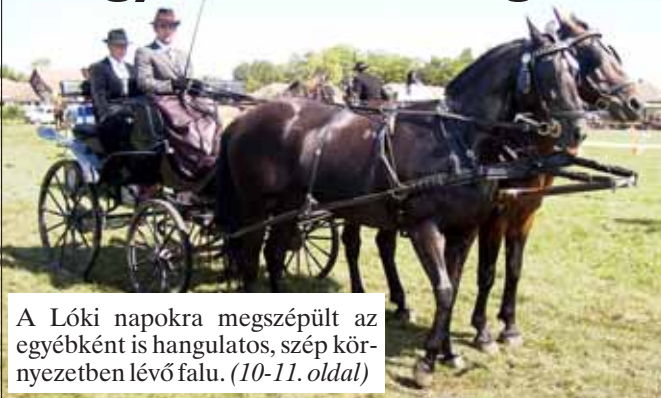
A Lóki napokra megszépült az egyébként is hangulatos, szép környezetben lévő falu. (10-11. oldal)