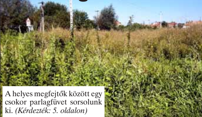
A helyes megfejtők között egy csokor parlagfűvet sorsolunk ki. (Kérdezték: 5. oldalon)