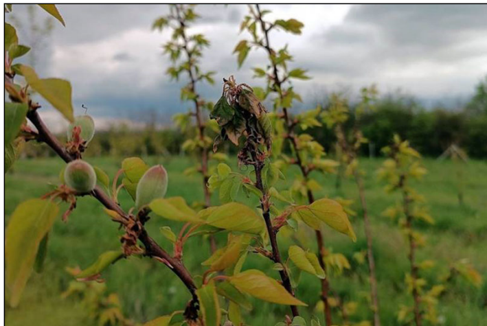
Monília okozta hajtásszáradás kajsziabarackfán

A virágfertőző monília legintenzívebben a meggyet támadja, így esetében kifejezetten fontos a védekezés a virágzás végéig, de érzékeny rá a szilva és a kajszi is. Kevésbé fogékony a cseresznye és az őszibarack.