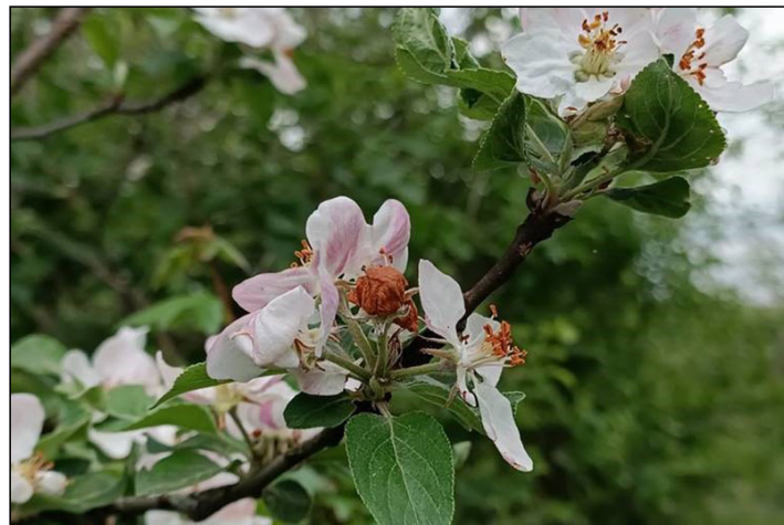
A bimbólikasztó bogár jellegzetes kárképe, a „rozsdás golyó”

A bimbólikasztó bogár ( Anthonomus pomorum ) látványos