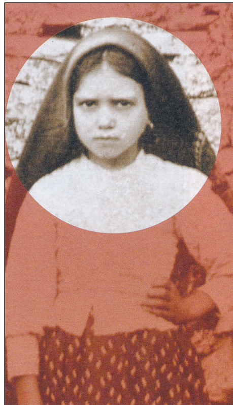
Szent Jácinta és Szent Ferenc

és a házastársakat a Szentháromság egy Isten életében és szeretetében részesíti. Akkor tudják a házastársak kölcsönösen megajándékozni egymást a szeretettel, amelynek Krisztus a forrása, ha