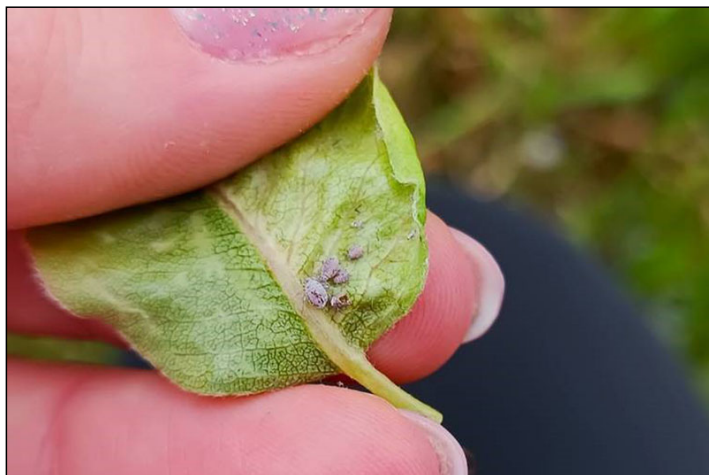
A szürke almalevéltetű-kolóniák sokasodnak a levél fonákán

Az alma teljes virágzásban van, míg a körte már a virágzás végén jár. Ez az időszak növényvédelmi szempontból nagyon meghatározó ezen növények számára, főleg mert a fertőzéshez szükséges feltételek optimálisak az alma- és a körtevarasodásnak ( Venturia inaequalis , V. pyrina ).