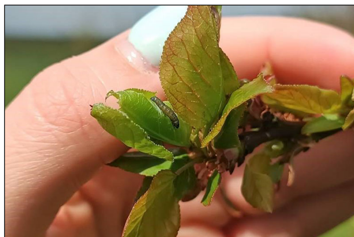
Sodrómolyárva a fiatal kajszi levelek között 7

„rozsdás golyónak” is nevezett kárképére is figyelhetünk az almavirágok között.