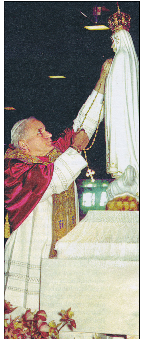
A Szűzanya megmentette II. János Pál pápa életét

magunkat egyetlen Üdvözítőnknek, Jézus Krisztusnak. ” Ezért mindennap bízzuk magunkat Szűz Mária Szeplőtelen Szívére, meneküljünk hozzá, és kérjük segítségét mindennapi életünk helyzetekben. Szűz Mária földi élete során hősiessé fokozott hitt. Az emberek szemében reménytelen helyzetekben hitt az emberi remény ellenére, ezért ő a legjobb tanító és kísérő a hit útján. Ő segít nekünk felkelni minden bűnből a bűnbánat szentségében, hogy a megszentelő kegyelem állapotában élhessünk. Emlékeztetni fog minket arra, hogy szenvedésünket egyéjszaka Krisztus szenvedésével, és ajánljuk fel a megrögzött bűnösök és az ateisták megtéréséért. Jézus Krisztus ezt mondta Fausztina nővérnek: „Imával és szenvedéssel több lelket menthetsz meg, mint