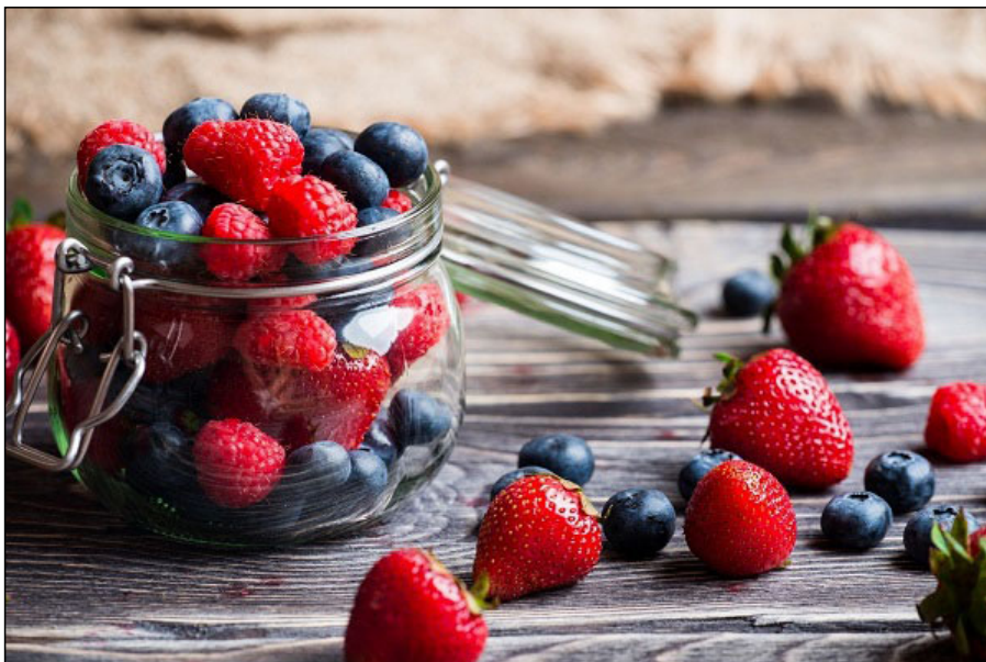
Fekete áfonya, málna, eper

A termés fogyasztásának hatására a megpattant hajszálerek