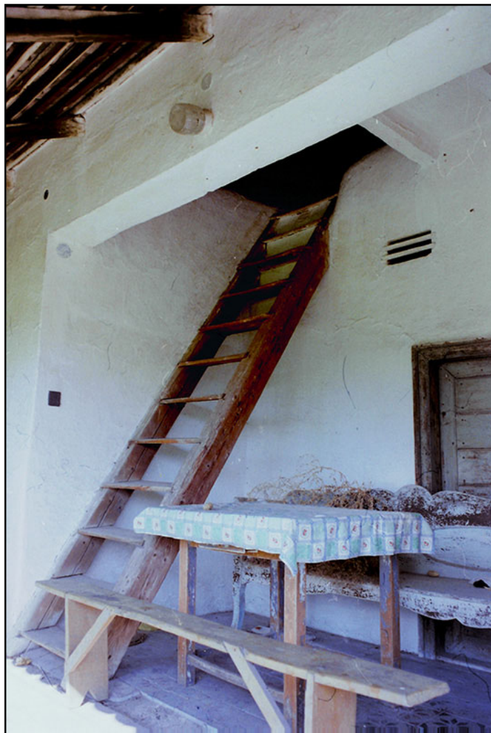
RÉGI ENDRŐDI KÉPEK Köszönet érte Liziczai Lászlónak!