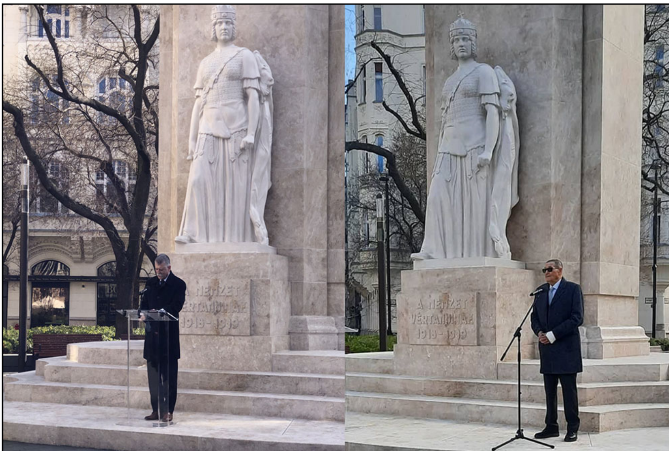
Kövér László Házelnök Úr részletes visszapillantást adott a kommunizmus legsötétebb időszakáról, amelyet a magyar nép elszenvedett.