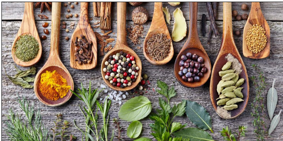
Boróka és más fűszerek