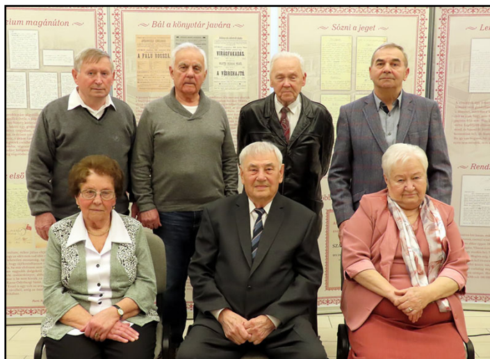
A könyvtárban beszélgettek a 80-as évekről