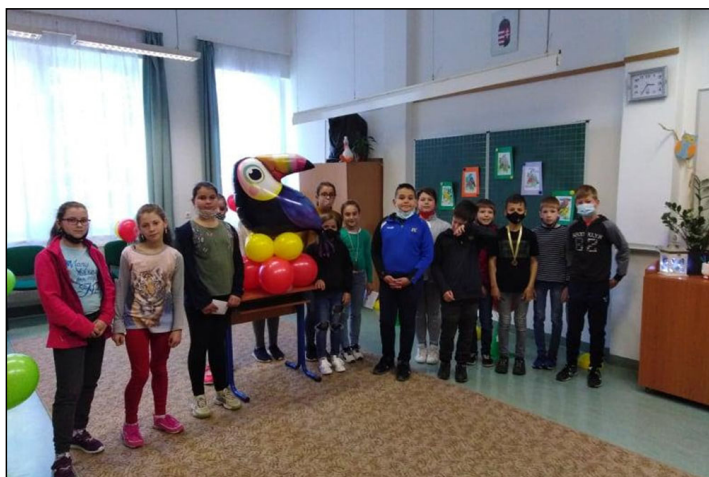
Madarak és fák napján