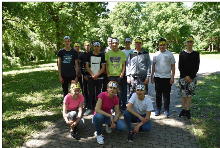
Hajrá 8. b