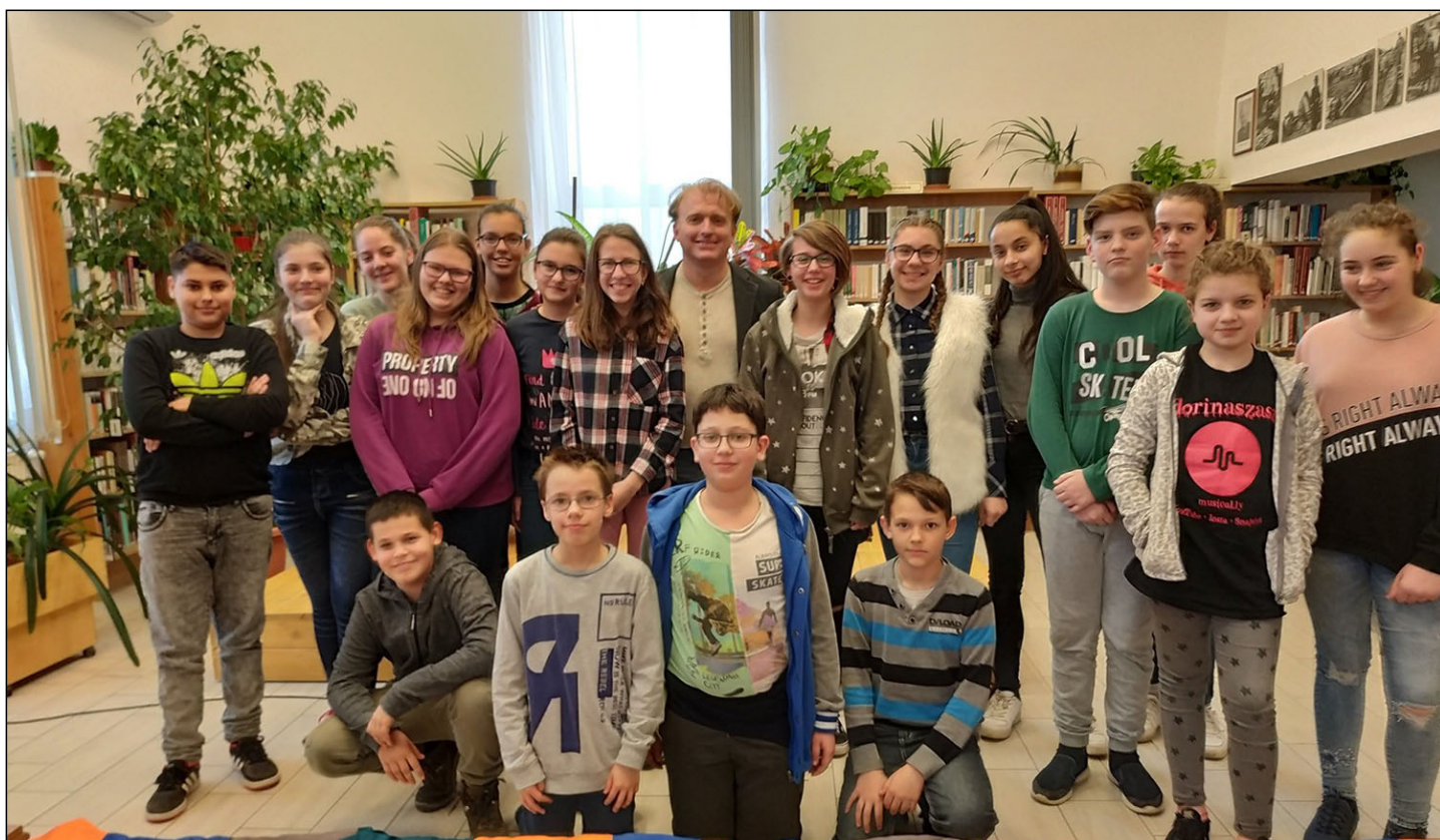
Egy gyermekelőadás után a gyomaendrői Határ Győző Könyvtárban 2019. március 21-én