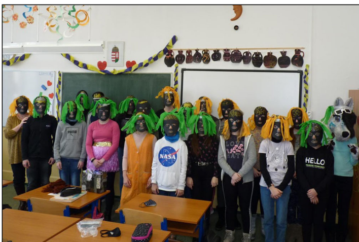
Farsang a felsőben

A XVIII. Bálint-Valentin Napi Kavalkád a járványhelyzet miatt rendhagyó módon került idén megrendezésre. A programok szervezését ebben a tanévben is a Diákönkormányzat vállalta magára. E jeles nap jelmondata volt: Jöhet a tavasz! Az előzetes feladatok között szerepelt az osztályterem dekorálása és télűző rigmusok gyűjtése. Néhány osztály kalandként fogta fel a napi programot, s jelmez is öltött magára. A kavalkád programjai