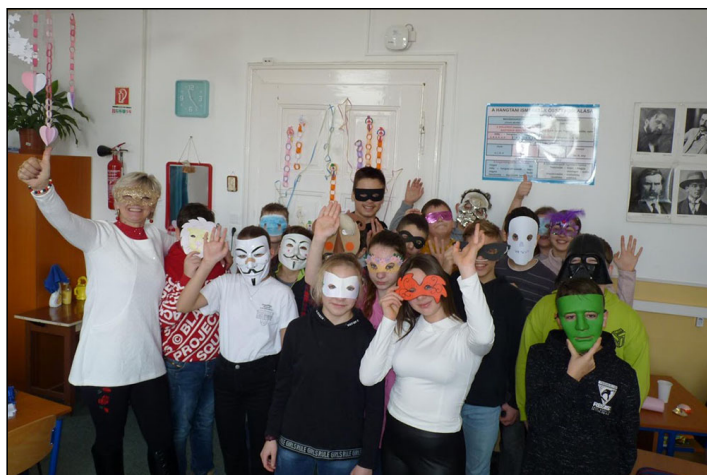
Farsang 7. a