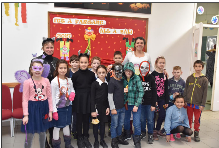
Farsang az alsóban