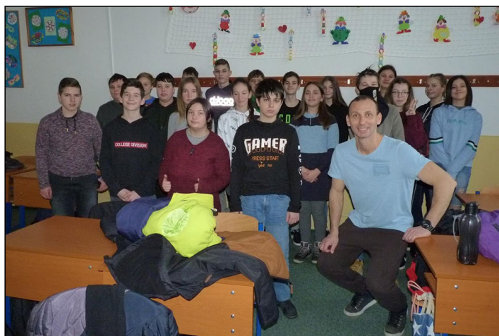
Farsang 7. b

a negyedik órában fánk evéssel, jelmezes fényképezkedéssel indultak. Az osztályok már korábban játékos feladatot adtak egymásnak. A játékok között volt kincskeresés, rajzolás és közösségépítő feladat is. Ötödik órában egy kilenc kérdésből álló kvíz-feladat és egy online kirakó várt az osztályokra. A leggyorsabbaknak 6 perc sem kellett a 60 darabos puzzle kirakásához. Az előzetes és az ötödik órában megoldott feladatokat pontoztuk. Az 5-6. osztályosok között az első helyezést az 5.a osztály szerezte meg, míg a 7-8. osztályosoknál a 8.a osztály bizonyult a legügyesebbnek. A győztes osztályok jutalma egy-egy csokitorta volt. Minden osztály elismerő oklevelet vett át helyezéséről, illetve a lelkes részvételéért. A nap programját tombolaárusítás is színesítette, amelyen 300 ajándék talált gazdára. A tombolatárgyak felajánlásáért szeretnénk köszönetet mondani a következő vállalkozóknak: