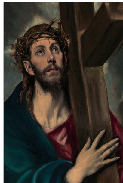
El Greco: Krisztus a keresztet hordozza (1580-1585)

A halál közelébe érkezett ember gondolkodása a haldoklása magányában, mindentől lecsupaszodva a lényegre egyszerűsödik le, a végső kérdésekre, a végső kérésekre. A Golgota-lépcsőn állok: így kezdődik a költemény.