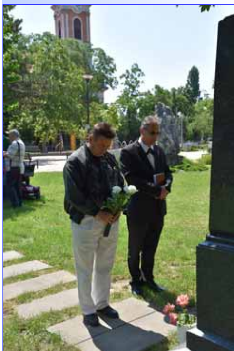
20. Trianon 100. évfordulója Hunyán