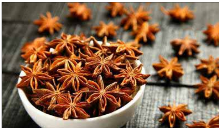
2. kép: csillagánizs

A Fülöp-szigetéről Angliába Sir Thomas Cavendish angol