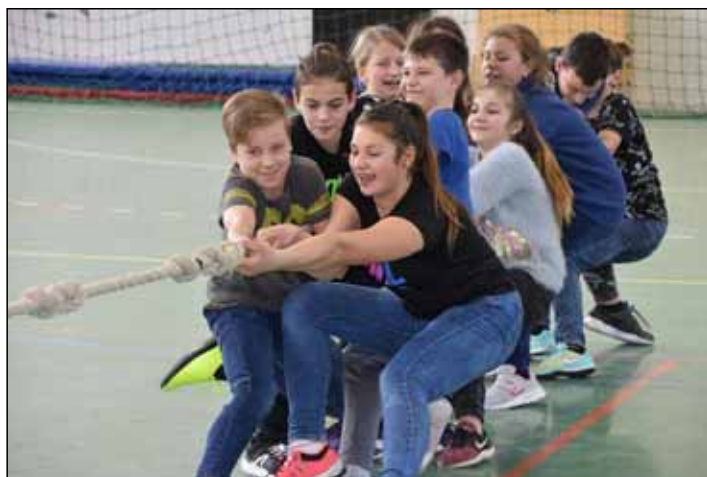
Kötélhúzás diák módra