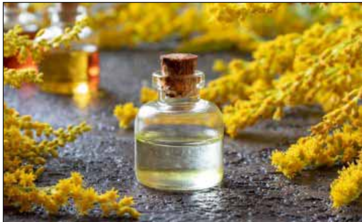
1. kép: ezerjófű

Dél-Európából származó, a tárnicsfélék családjába tartozó gyógynövény, legkedveltebb lelőhelyei a déli fekvésű hegy- és domboldalak. Magyarországon napos, nedves réteken, domboldalakon, cserjés, homokos helyeken vadon termő, mezei növény. A mitológia szerint nevét Khiron kentaurról kaphatta, a növény latin nevének jelentése: „100 aranyat érő fű”. A magyar név alapján: „ezer bajra való” gyógynövény. Az ezerjófű a legtöbb kö-