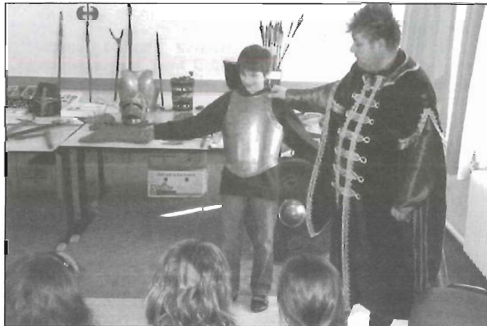
Páncél próba a történelemórán

A középkor életébe kapcsolódhattak be a gyerekek egy interaktív történelemóra során. Megismerkedtek a békés hétköznapok nehézségeivel, majd kipróbálhatták a korabeli harci eszközöket, páncélba öltözhettek.