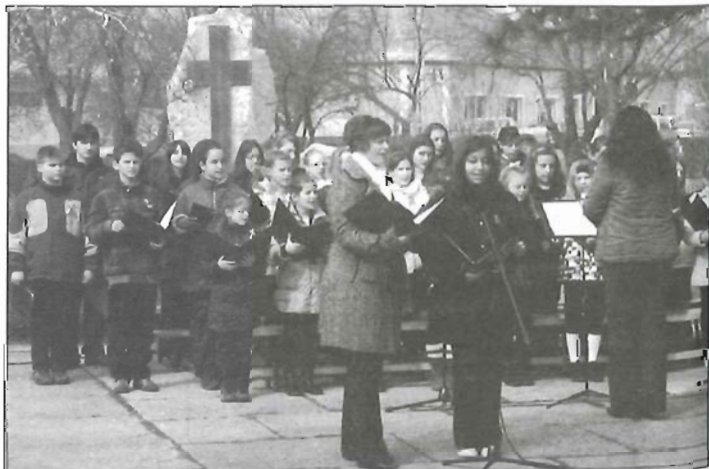
Rózsahegyisek műsora a városi ünnepségen

Az iskola életéről további információkat, képeket találhatnak az iskola honlapján: www.rozsahegyiskola.hu