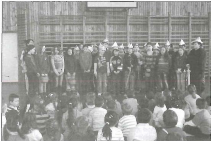
Iskolába hívogatnak a Gergely-járók

Iskolánkban március 6-7-8-án nyílt napokat tartottunk. Ekkor bárki ellátogathatott intézményünkbe, megtekinthette az ott folyó munkát.