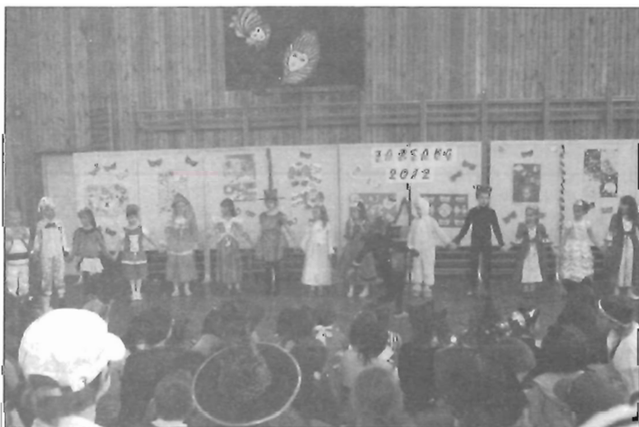
Az elsősök jelmezes felvonulása

Hagyományos farsangi jelmezbálunkon közel háromszáz tanuló öltött maskarát. Voltak bohócok, királylányok, boszorkák, különböző állatok és mesék szereplői. A felvonulás, bemutatkozás, közös játékok és tánc után az osztálytermekben folytatódott a mulatság.