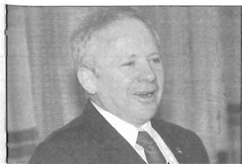
Egyházközségi farsangi vacsora - 20. oldal