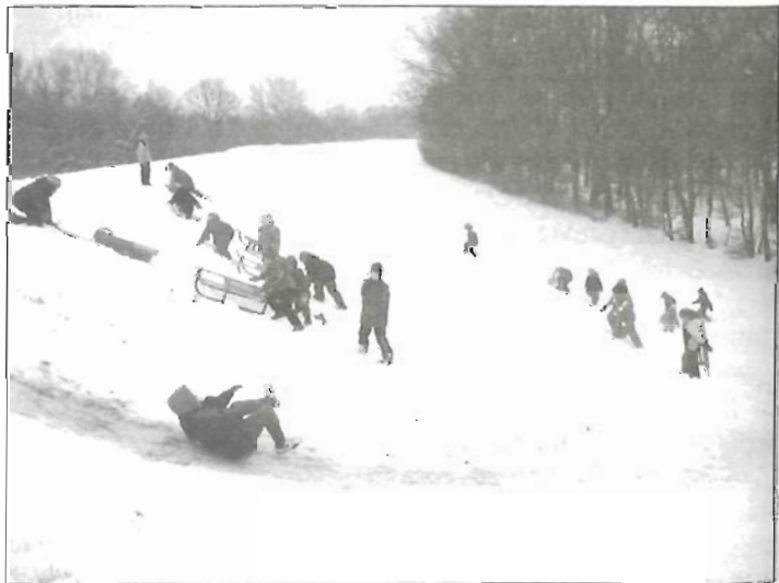
Könnyebb csúszni, mint mászni

Az iskola életéről további információkat, képeket találhatnak az iskola honlapján: www.rozsahegyiskola.hu