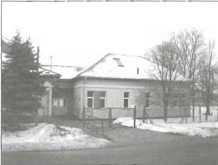
A Rózsahegyi Ház várja látogatóit

A Rózsahegyi Iskola Diákjaiért Alapítvány egyik célja, hogy támogatást nyújtson a hátrányos helyzetű csoportok esélyegyenlőségének elősegítéséhez. Ezért pályázott 2009-ben az Integrált Közösségi Szolgáltató Tér kialakítására. Az elnyert közel 50 millió forintból tíz hónap alatt készült el Öregszőlőben, a Szent Imre Idősek Otthona épületével egy egységben lévő impozáns épület, mely a Rózsahegyi Ház nevet kapta. A 170 négyzetméteren helyet kaptak klubszobák, előadótermek, található benne könyvtár és több számítógép internet hozzáféréssel. „A közösségi tér sikeres működtetéséhez a Rózsahegyi Iskola Diákjaiért Közhasznú Alapítvány, Gyomaendrőd Város Önkormányzata, valamint az alapítvánnyal együttműködő intézmények, civil szervezetek összefogása szükséges” – olvasható a hivatalos sajtóközleményben.