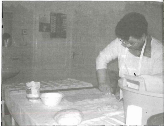
Készül a feledhetetlen fánk a szentgellértesi iskolai farsangra