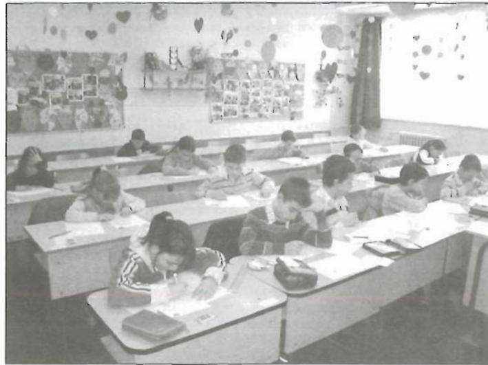
A harmadikosok és negyedikesek egy csoportja a matekversenyen

Az idei tanévben is iskolánkban írhatták meg a város matematikát kedvelő gyerekei az ország legnépszerűbb tesztversenyét. A verseny elsődleges célja a matematika népszerűsítése. Az összeállított feladatsorokkal elsősorban a tanulók logikus gondolkodását kívánják mérni.