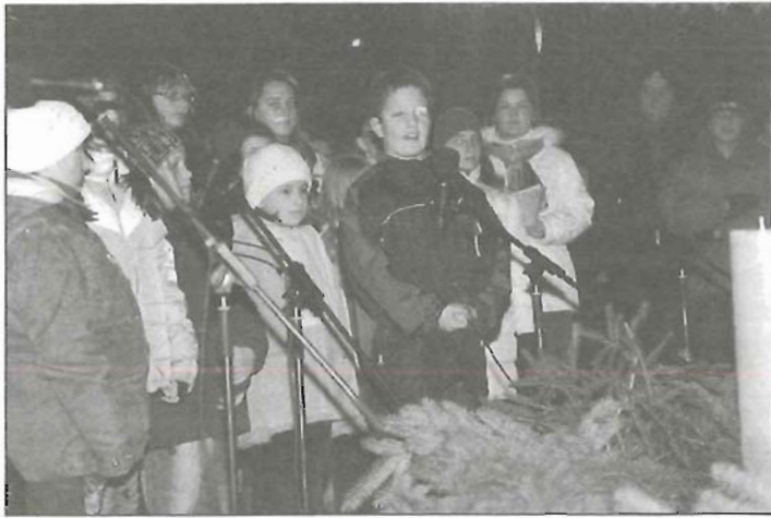
Városi adventi gyertyagyújtás