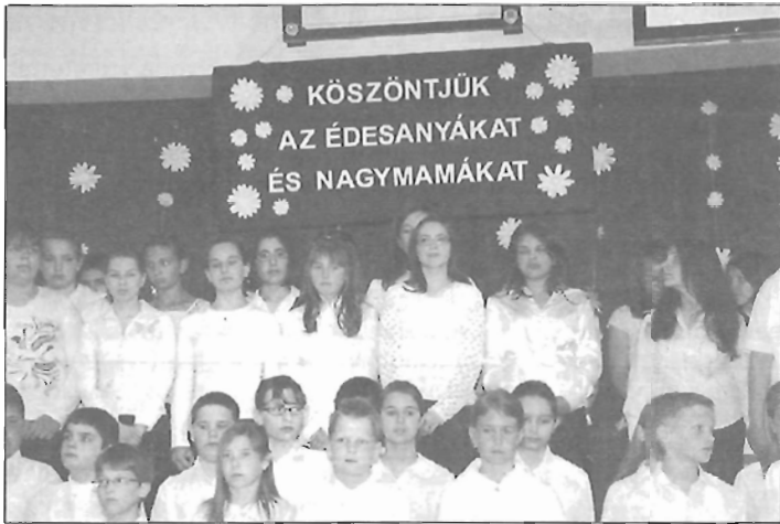
Anyák napja Iskolánkban