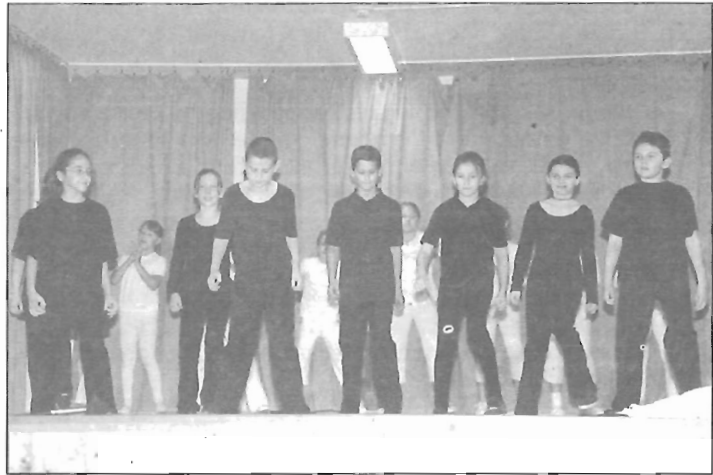
Szent Gellért Nap