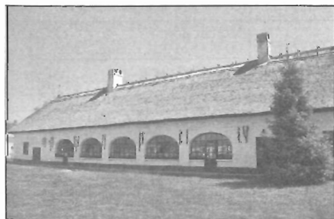
Csárdák - 10. oldal

A kommunizmus áldozatainak emléknapija Magyarországon - 9. oldal