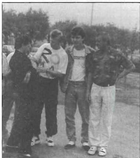
20 éve történt - a Barátság SE életéből III. - 12. oldal (Képünk: Détári Lajos)