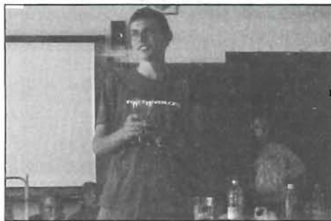
Öveges Józsefre emlékeztek a szentgellértesek - 7. oldal