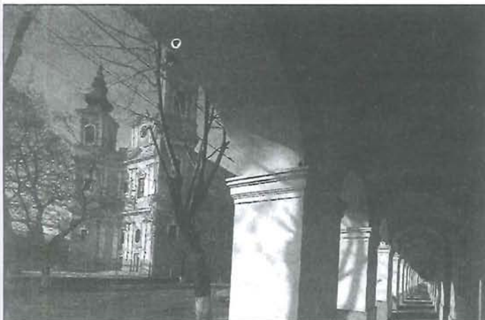
A nagyváradi híres kanonoksr

Összefoglalva láthatjuk, hogy a Trianoni határmódosítás előtt falunk élén kapcsolatot ápolta a Partium településeivel, elsősorban Nagyváradal. Hamarosan megnyílhat a határ újra hiszen Románia felvételével az Európai Unióba a két ország közötti elválasztó vonal is jelképpé válik. A lehetőség, hogy újra felismerjük a korábbi lehetőségeket, melyek Békés megye és a Partium vidékének kapcsolatából ered segít feledtetni azt a példátlan tettet mellyel gátat vontak a több száz éves hagyományok közé. Ebben a szempontból Gyomaendrődnek (Endrődnek) is nagy lehetőségei vannak, csupán értékelnünk kellene azokat a pontokat, melyek történelmünk során összekötöttek bennünket. Ennek szellemében emlékezünk június 4-én az endrődi katolikus templomban és 5-én a református templomban a Trianoni emléknapra.