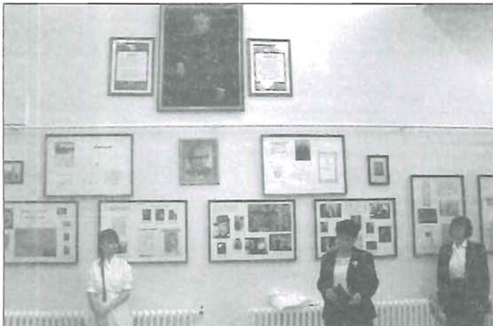
Vincze Zsuzsa Rózsahegyi festményt ajándékozott az iskolának

Rózsahegyi Kálmán halálának 50. évfordulója és az endrődi ligetben beindított oktatás 50 éves évfordulójára emlékeztünk az Endrődiek Baráti Körével együtt.