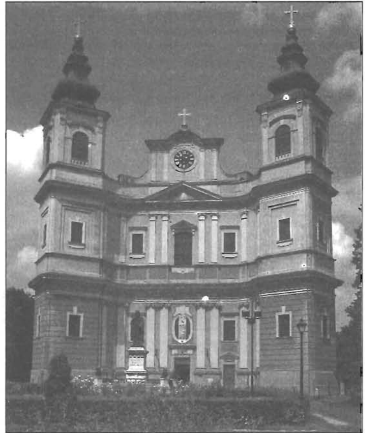
Nagyváradi Szent László székesegyház

A térségünk a határmódosítás előtt a nagyváradi térséghez tartozott. Ha Gyomán felültek nagyanyaink a vonatra egészen Nagyváradig utazhattak, sőt arra is sikerült adatokat gyűjteni, hogy termékeikkel kijártak a váradra és gyakran voltak vendégei a Félix fürdőnek. Ugyanúgy a Várad környéki gazdálkodók áruik megjelentek az endrődi vásárban is. Tehát a korábbi időszakban élénk gazdasági mozgás volt térségünk és a Partium települései között. Az endrődi vásár jelentőségére is fel kell hívni a figyelmet, ugyanis fontos árucserre pontja volt az erdélyi állatkereskedelemnek. Az olcsó lábasjóságok nagy része az endrődi vásárban talált gazdát, majd innen hajtották lábon a Felvidékre és a nyugat-