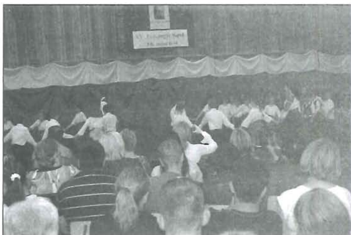
Több mint 200 gyerek szerepelt a népes közönség előtt a gálaműsoron

Este a Rózsahegy-díjasok fát ültettek a Ridegvárosi játszótéren. A gyerekek kedvükre futkoshattak, luft hajtogattak, vattacukrot majszoltak, a felnőttek pedig jól kibeszélgették