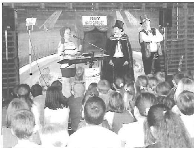
A Parádé Nagycirkuszt árgus szemmel figyelték a gyerekek a Rózsashegyi Iskolában

A Parádé Nagycirkusz bohócaiként léptek fel a Bibuzsi Gyermekszínház színészei. Negyedik alkalommal tartottak ingyenes előadást Csárdaszálláson és Endrődön egy TÁMOP pályázat segítségével.