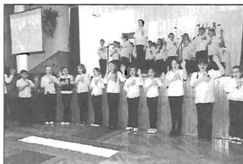
Március 15-e ünnepe Hunyán képek - 4. oldal