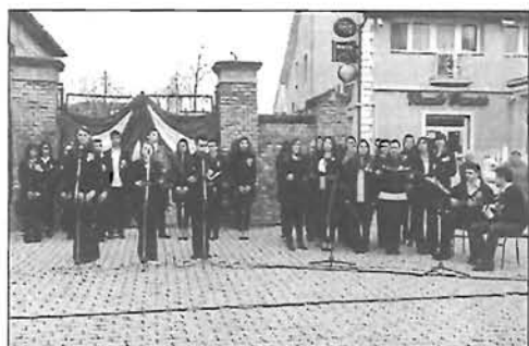
Március 15. Gyomaendrődön - képek - 20. oldal