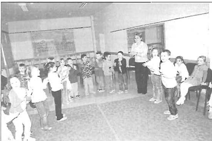
Az ovisok jól érezték magukat az iskolában

Csütörtökön teadélután szerveztünk a leendő iskolásoknak. Táncoztak, énekeltek, tornáztak, kézműves foglalkozáson vettek részt. Kellemesen elfáradva jóízűen fogyasztották el a szakács nénik sültötte finomságokat.