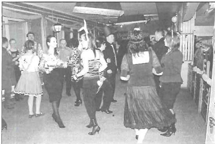
Jelmezesek és civilek együtt mulattak az SZMK vacsorán

Február 26-án volt iskolánk jótekonysági bálja a Bowling étteremben. Ez évben a farsang jegyében tartottuk meg, így többen álruhát öltöttek. A zsűri több kategóriában értékelt a jelmezeket. A legszebb, legcsúnyább, legötletesebb jelmezeket díjazták is. Az est nagyon jó hangulatban telt el. A gyerekek nevében köszönjük mindenkinek, aki támogatta rendezvényünket. A bevételt gyerekek jutalmazására és játékok vásárlására fordítjuk.