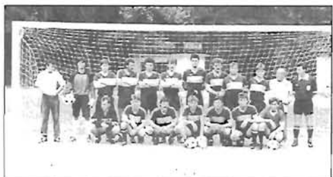
20 éve történt - a Barátság SE megalakulása - 12. oldal