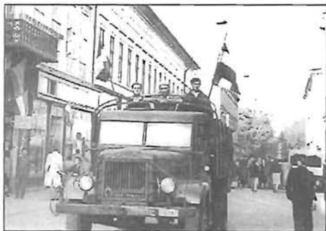
Októberi forradalmunk hősei - 4. oldal