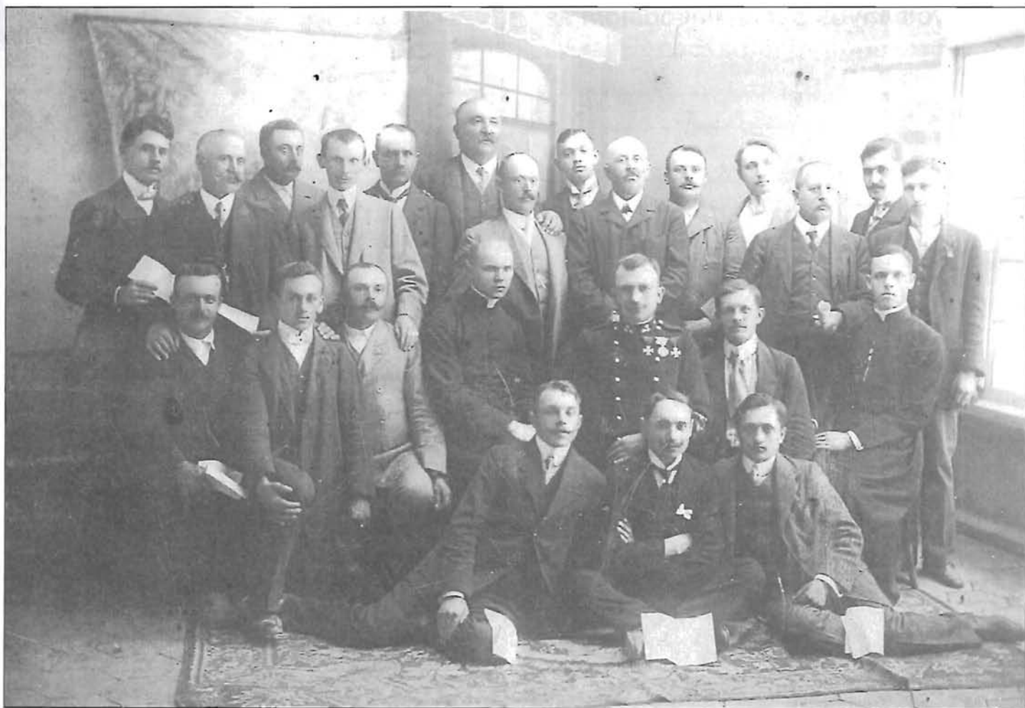
Emlék az 1914. május 25-én tartott endrődi híd fölszentelésekor - a Dalárdisták