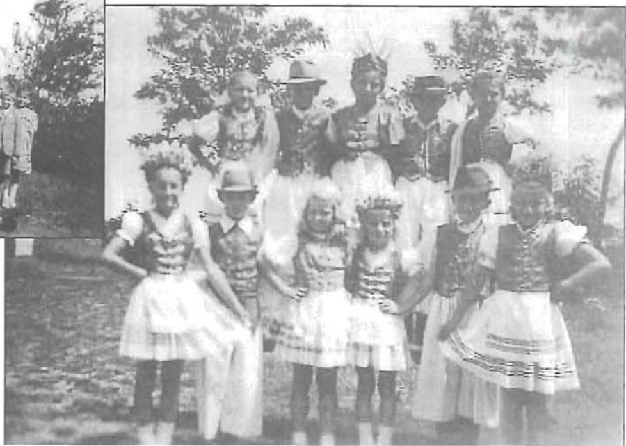
Polyákalmi iskolai szüreti ünnep 1949