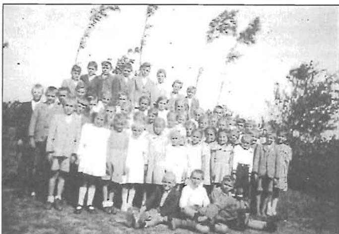
Polyákalmi iskolai vizsgái kép 1948