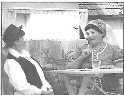
Kerti parti Hunyán - 16. oldal