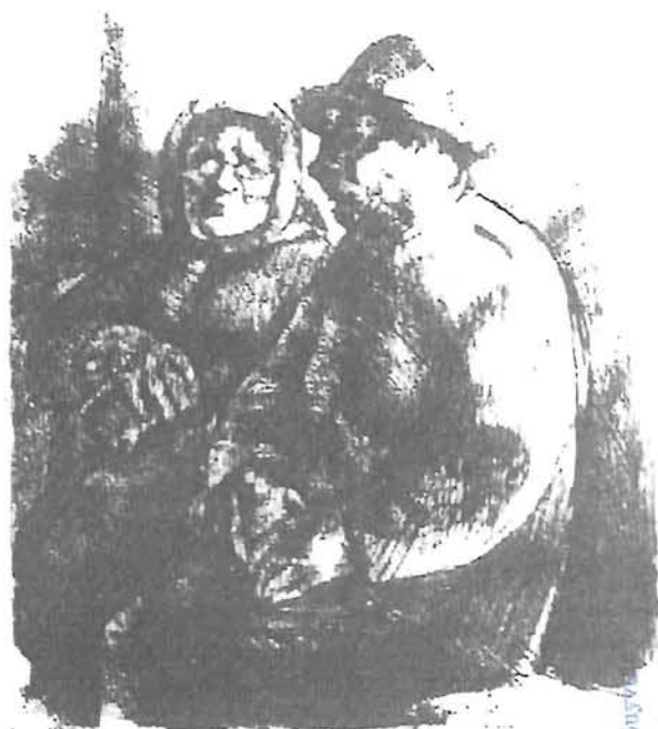
Szőnyi István: Öreg házaspár (1922)

Meg kell őriznünk hagyományainkat és meg kell becsülni az idősek által képviselt erkölcsöket, a józan eszt, a tiszta szellemet, a tenni akarást és a kitartás fontosságát, melyek példamutatóak lehetnek számunkra. Az unokák, dédunokák továbbvihetik mindazt, ami szép, ami igazán értékes. Egy örömmel és küzdelmekkel teli élet után ők már tudják mi a jó, mit kell tovább adni és mi a rossz, amit el kell kerülni az utánuk jövő generációknak.