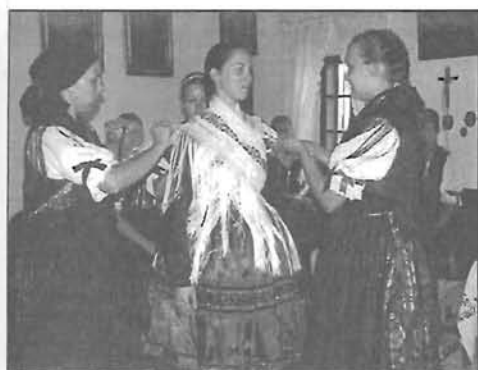
Parasztlakodalom a Tájházban - 10. és 20. oldal