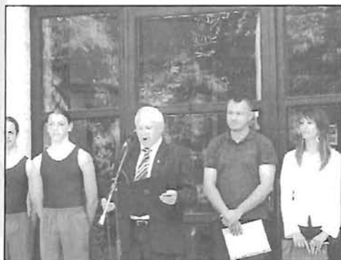
Kis Bálint Napok - 12. oldal