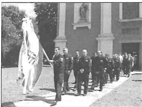
Tűzoltók eskütétele és gépjármű szentelés - 16. oldal