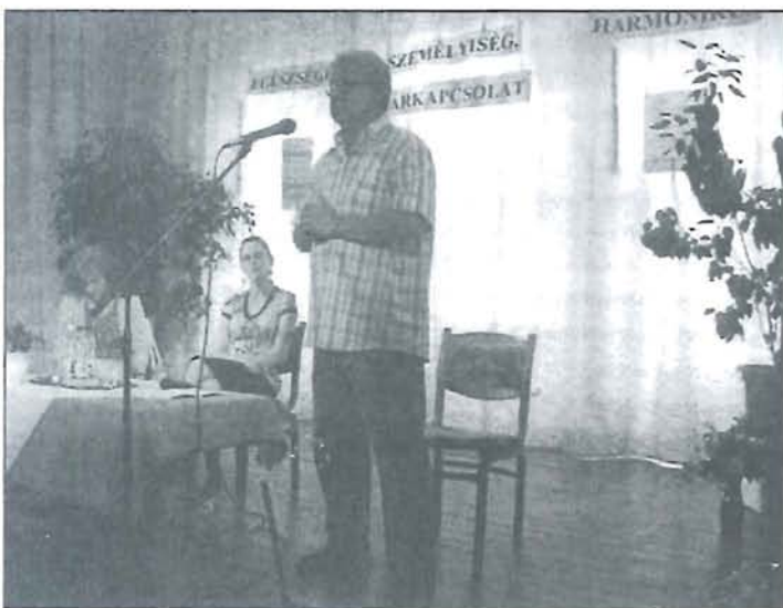
A képen balról jobbra haladva: