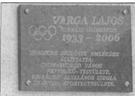
Varga Lajos nevét vette fel a sportcsarnok - 13. oldal