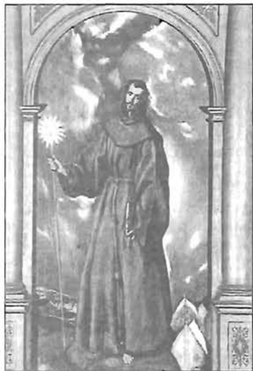
El Greco: Szent Bernardin

*Massa (Sziéna mellett), 1380. +Aquila, 1444. május 20.