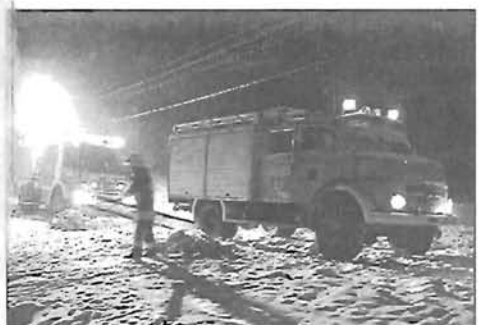
Teljes erőbedobással működik a Tűzoltó Egyesület - 16. oldal