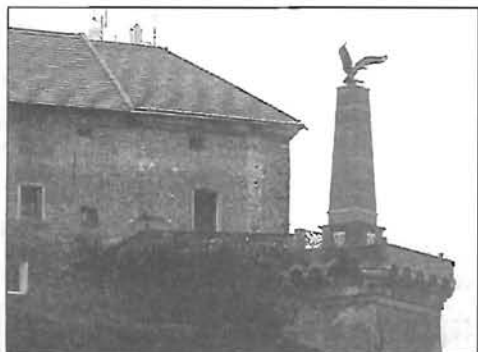
Visszaszállt a magyar turulmadár - 13. oldal