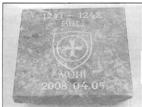
Muhi alapkövetétel és szentelés - 12. oldal

Rózsahegy Napok, és endrődiek találkozájának programja - 7. oldal