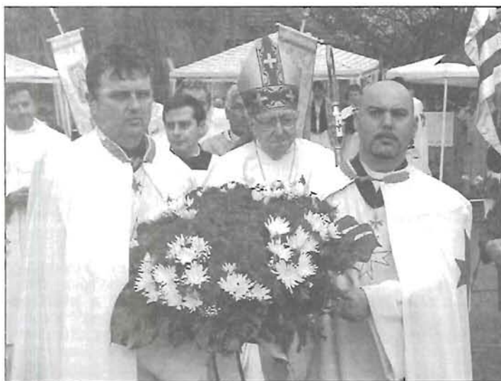
Dr. Paskai László bíboros és a Templomos Lovagrend koszorút helyez el IV. Béla király és az elesett 60 ezer magyar áldozat emlékére a Templomos Lovagok terén

Köszönjük mindazoknak, akik eljöttek és a szervezésben, az előkészületekben részt vettek, és azoknak, akik koszorút helyeztek el hőseink emlékére.