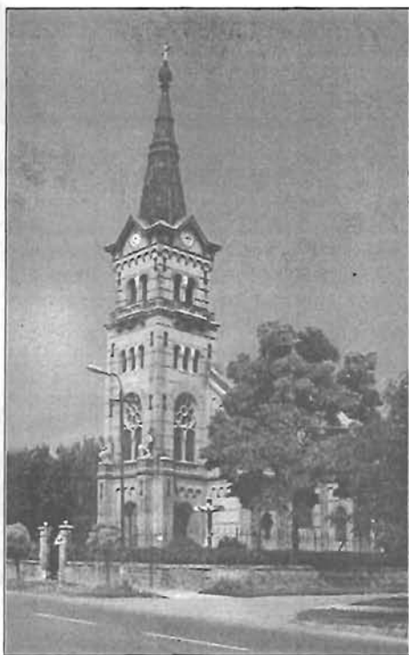
120 éves a gyomai katolikus templom