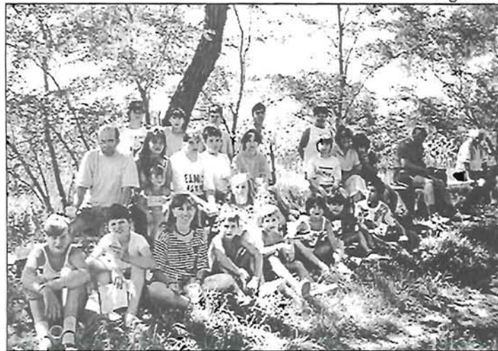
a foglalkoztatótábor képei

Mind ezekben a sikerekben jelentős része volt a Rózsahelyi Kálmán Általános Iskola hozzájárulása is. Köszönjük!