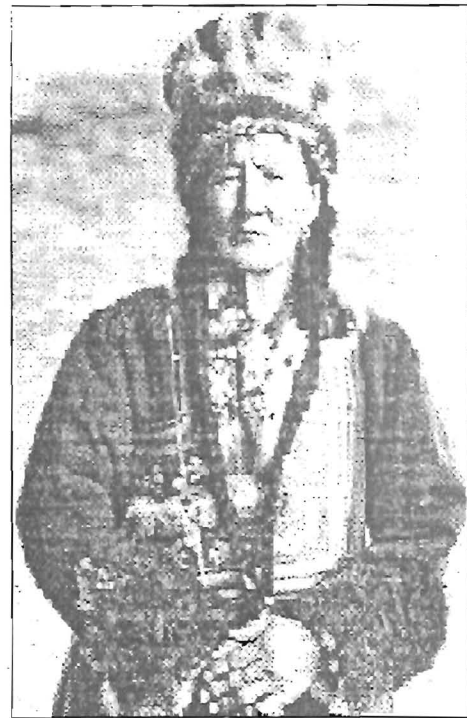
Telengit sámanasszony (Altaj, Kosagas)