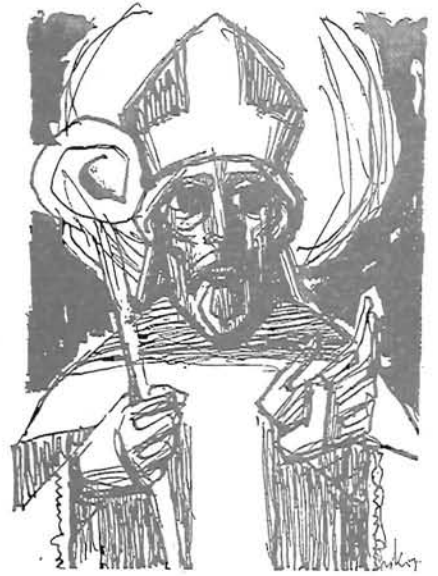
Gellért, nemzetünk tanítója