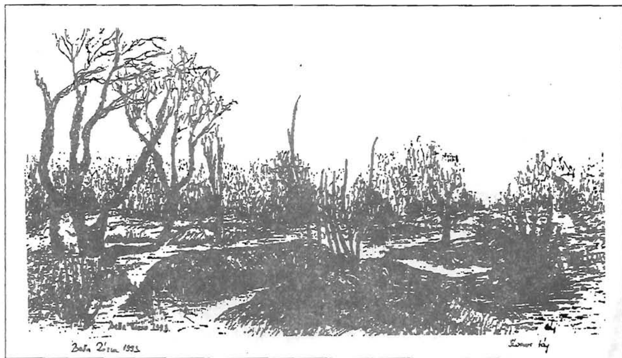
Bella Rózsa: Komor táj (1993)