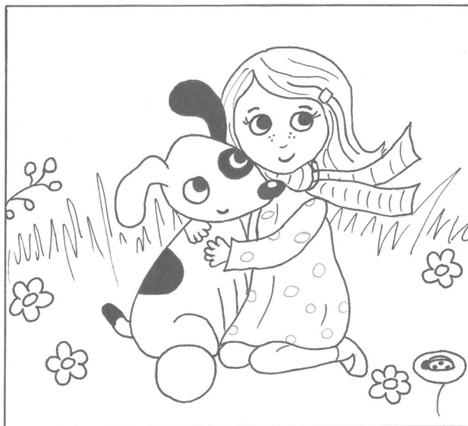
Stanczelné Piroksa könyvtáros

Ha kedved tartja, színezd ki a „Mentsük meg a kiskutyám” című könyv borítójáról készült rajzot!