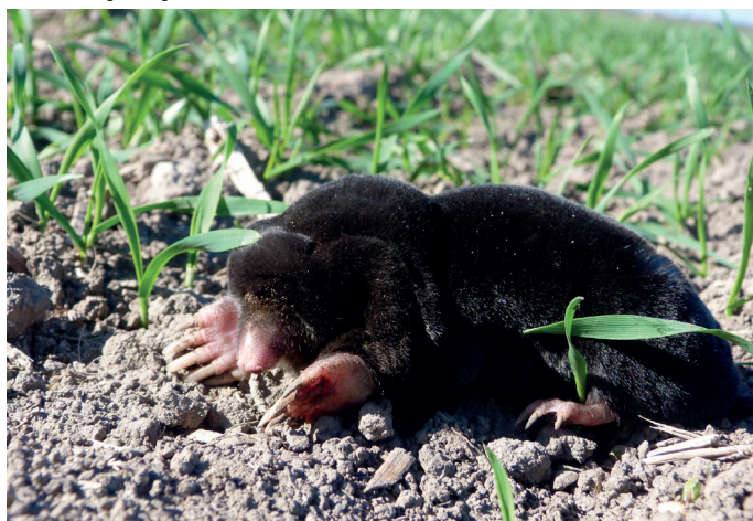
A hónap képe

Fónad József „Adonyért” Alapítvány kuratóriumának elnöke