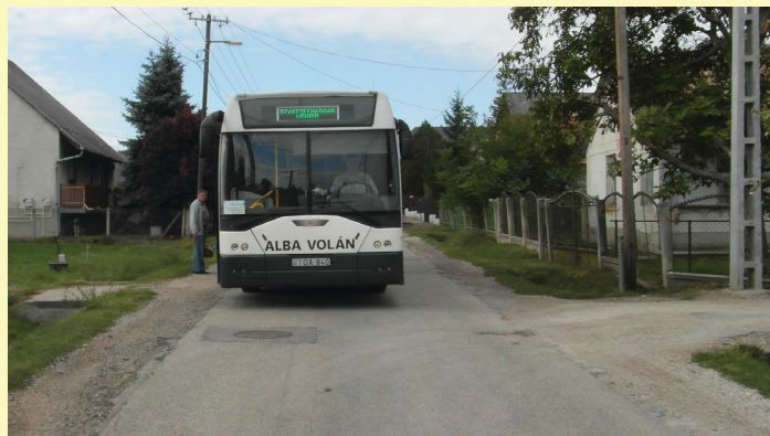
Szűk keresztmetszetű út

dani. Jogerős építési engedélyek 2012-től rendelkezésre állnak, a kivitelezési munkákra még abban az évben beadott pályázat sajnos nem kapott támogatást.