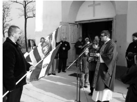
Tisztelettel: Szittyá Sárrét Vidéki Lovas Egyesület

Bármilyen kérdés, építő kritika jut kedves olvasóink eszébe, nyugodtan vegyék fel velünk a kapcsolatot. Egyesületünk mindennapjainak részleteit illetve elérhetőségeinket, fellelhetik a www.szittyalovas.uw.hu címen található internetes portálunkon.