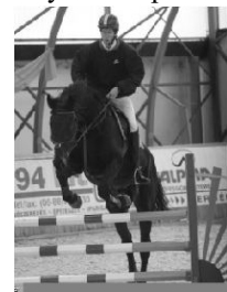
2008, fedeles bajnokság

Mindenkit szeretettel várunk, aki valamilyen módon kötődik a lovakhoz, lovagláshoz, vagy egyszerűen csak szeretne kikapcsolódni, pár percre kilépni a hétköznapi szürkeségből.