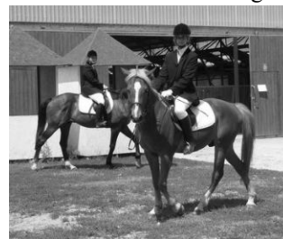
2008 nyár, Póni Klubos verseny

Az egyesület lovasai jelenleg díjugratásban és póni klubos versenyeken vesznek részt országos versenyeken, reményeink szerint a jövőben a többi lovas szakágnak is eredményes szereplői lesznek.