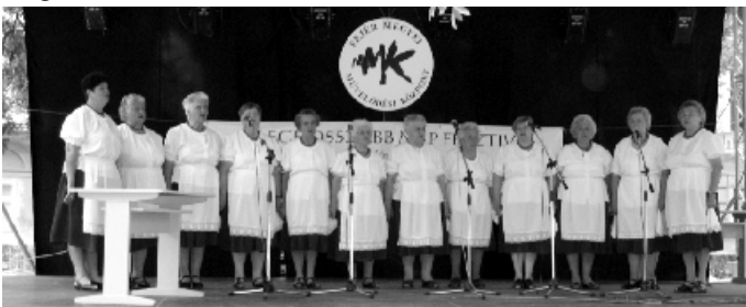
Az egyesület tagjaiból alakult meg 1996-ban az „Őszirozsa népdalkör”.

A Nyugdíjas Egyesület ebben az évben ünnepli megalakulásának huszadik évfordulóját. Ebből az alkalomból kerül sor április hónapban egy jubileumi rendezvényre, melyen méltó módon szeretnénk megemlékezni e jeles évfordulóról. Az egyesület jelentős szerepet játszik a település közösségi életében, és megalakulásakor az egyetlen szervezett formában működő társadalmi csoport volt Úrhidán. Az egyesület tagjai túlnyomó többségben a falu törzsgyökeres tagjaiból kerültek ki és jellemzően a többséget képezik napjainkban is. A közösség élen jár a régi szokások és hagyományok felelevenítésében és ezeknek a megőrzésében, továbbadásában.