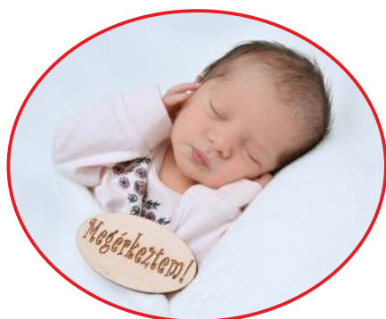
Márta Zoé január 22.