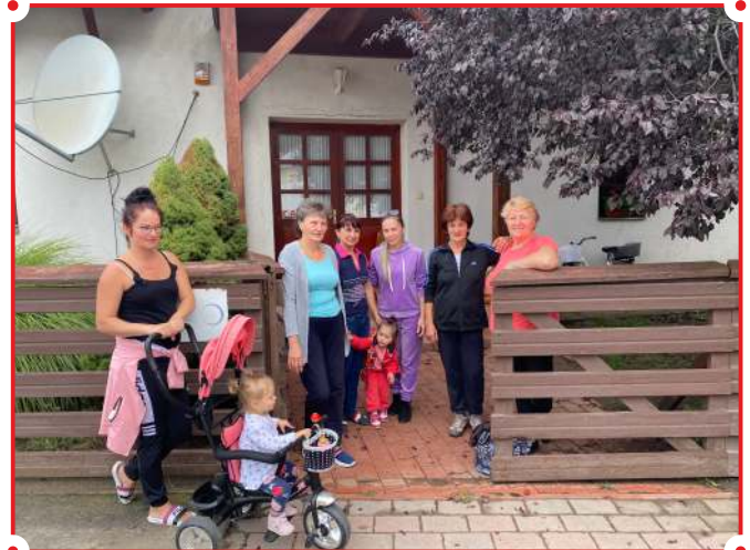
Nyári hangulatban – a református ifjúsági üdülő előtt