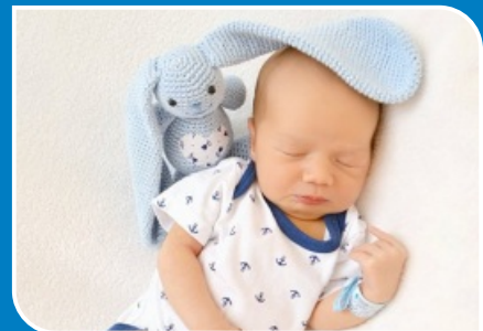
Virág Mátyás 2017. augusztus 1.