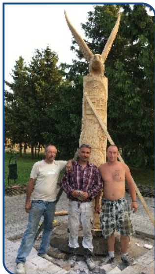
Mester és tanítványai