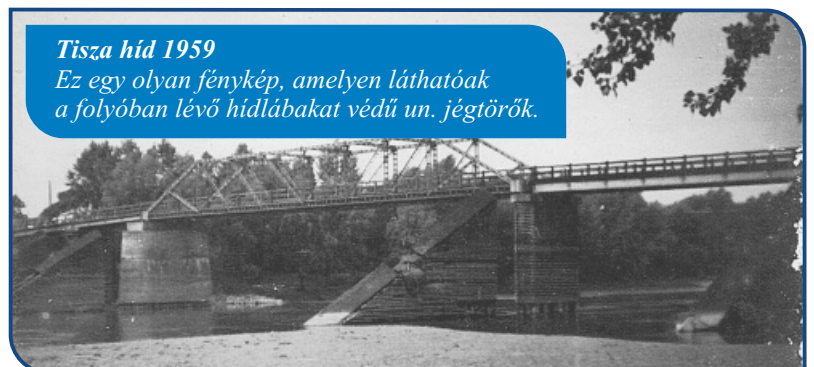
Tisza híd 1959 Ez egy olyan fénykép, amelyen láthatóak a folyóban lévő hídlábakat védő un. jégtörők.