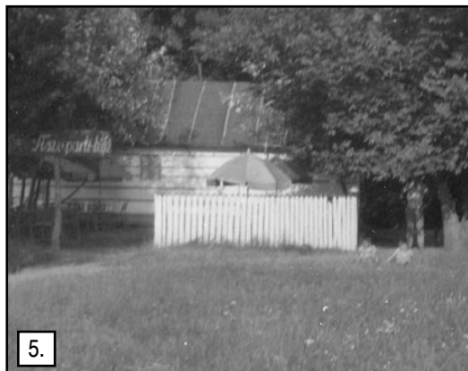
5.kép A halászcárda elődje a tisza-parti büfé 1961