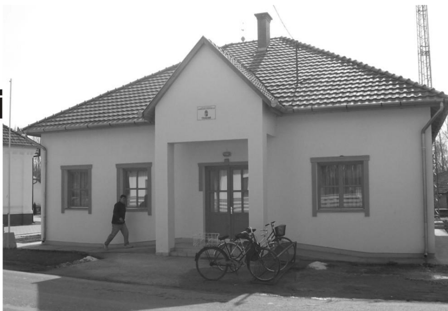
A Gondozási Központ - egyelőre - funkció nélküli épülete

A veszteséges intézményt a február 20-i rendkívüli testületi ülés 5 igen, 1 nem szavazattal március 1-i hatállyal bezárta, ami, sajnos két dolgozó létszám csökkenésével is járt.