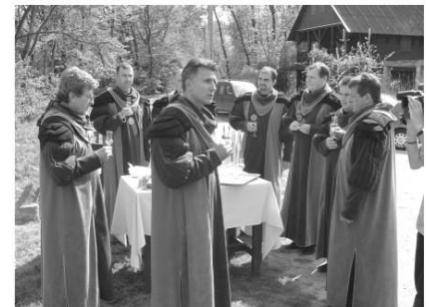
A Pálinka Lovagrend tagjai az ünnepségen

A ceremónián a Lovagrend tagjai szakmai egyeztetést is tartottak. Beszámoltak többek között arról, hogy a felmérések szerint a térség