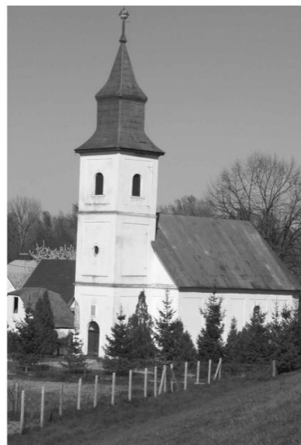
Az 1794-es árvízet követően a falu új templom építésére kényszerült

1641-ben már volt iskolája és tanítója. 1910-től pedig állami iskolája. 1942-től, a Tisza-híd megépítésétől kezdve a szomszédos Kisarral működtetett közösen iskolát.