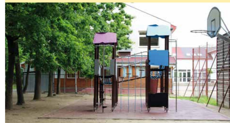
A 4,3 millió forintos beruházás keretében megépült játszótér májusban átadásra került a Hajdúböszörményi Tankerületi Központnak köszönhetően.

Általános Iskolából, a téglási II. Rákóczi Ferenc Általános Iskolából, valamint az Újfehértói Általános Iskolából érkeztek. A találkozó nemcsak a gyerekeknek adott lehetőséget hangszertechnikai képességeik bemutatására, hanem a pedagógusoknak is teret adott a szakmai konzultációkra, a tapasztalatcserére. A találkozón a gyerekek teljesítményükért minősítéseket kaptak.