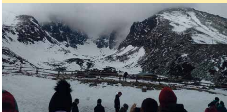
A Határtalanul Program keretében szlovákiában jártunk, többek között a Tátrában és a Kassán található Rákóczi emlékhelynél.