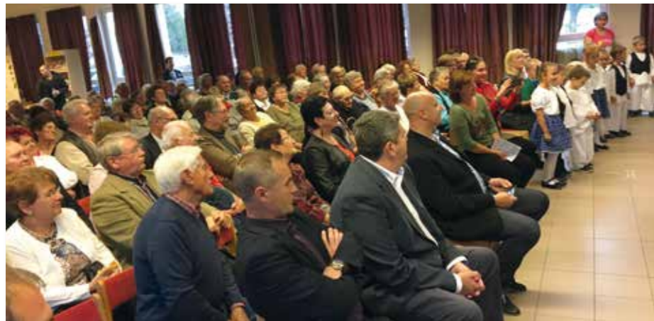
Településünkön az idősek száma közel 600 fő, közülük sokan részt vettek az idei idősek napi rendezvényen.