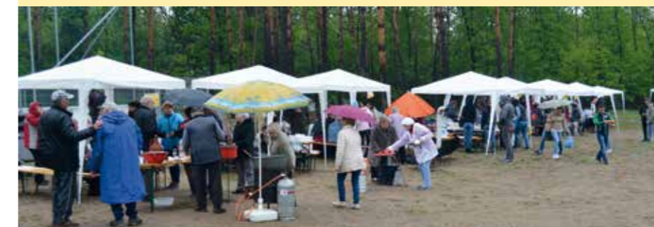
A Majális a kedvezőtlen időjárás ellenére is nagy érdeklődésre tett szert. A rendezvényre kilátogatókat változatos programok várták.