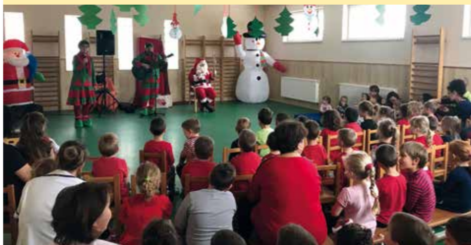
A „Bigyóka” színjátszó csoport műsora. A Debreceni Méliusz Juhász Péter Könyvtár Mikulás napi programmal kedveskedett a gyerekeknek.

las, jó hangulatú előadást nyújtott részünkre.