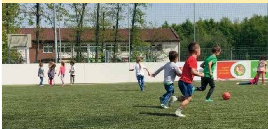
Az óvodásoknak is lehetősége nyílik arra, hogy használják az új műfüves foci pályát.