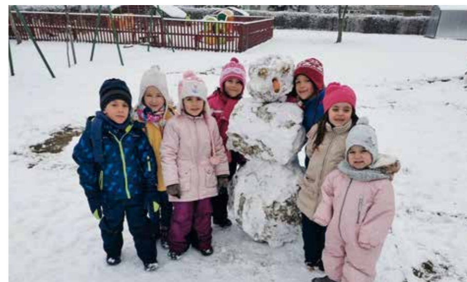
A mindennapos testnevelés, a napi levegőzés, udvari játék, séták és kirándulások télen is mind hozzásegítik a gyermekeket az egészséges életmód kialakításához.