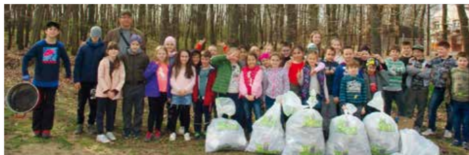
Az iskola Madarász sulijának tagjai 2019-ben is csatlakoztak az országos mozgalomhoz, a TeSzedd! programhoz. A gyerekek szorgalmasan gyűjtötték a hulladékot.

A munka- és balesetvédelmi oktatás után remek, napsütéses időben láthatott a csapat munkához. A gyerekek nagyon fegyelmezten és szorgalmasan gyűjtötték a hulladékot, így az iskola környékén, a közeli erdőben és a vasútállomás mellett