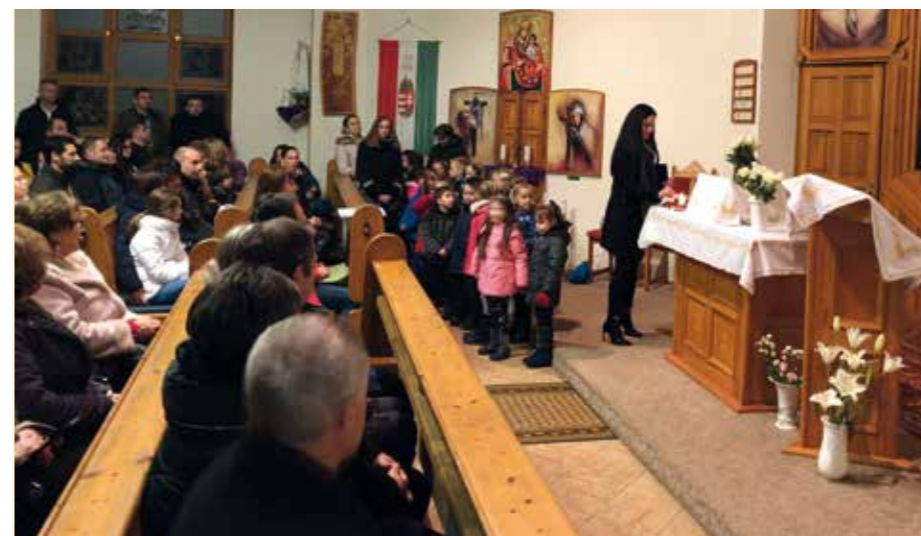
Az év végi adventi vásárnapokon a település hagyományának megfelelően az ökumenikus templomban gyűlünk össze, hogy meggyújtsuk az adventi gyertyákat. Az ünnepi beszédeket az óvodások és iskolások műsorai teszik még emlékezetesebbé és meghitté.

December 13-án karácsonyi vásárt tartottunk. A vásár ideje alatt nagyon sok természetbeni adomány érkezett az adománygyűjtő pontra a hátrányos helyzetű családok számára. A felajánlásokat a humánszolgáltató központ munkatársai juttatják el a családokhoz. Minden felajánlást köszönünk!