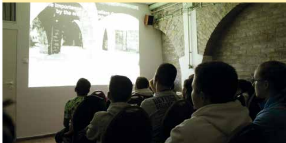
A Honvédelmi Sportszövetség támogatásával Budapesten, Isaszegen és a Felvidéken jártunk.

a Szent Jakab templomot tekintették meg a gyerekek. Majd a késmárki Thököly-vár és a Tátrában található Kő-pataki-tó felkeresése következett. Az utolsó napon a Szepesváralján található templomot, a szepesi várat, valamint Kassán a Rákóczi házat látogatták meg a kirándulók.