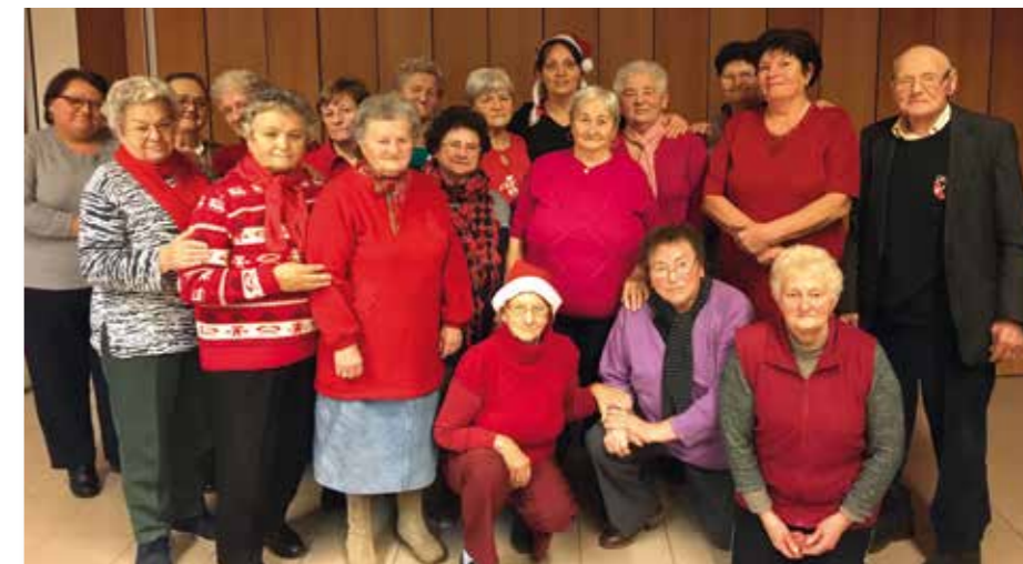
Vidám együttlét Mikulás napja alkalmából az Idősek Klubjában.

A családi bölcsődébe járó gyerekek hetente egy alkalommal az épületben működő Sósobában játszanak, így az önfelelt játékkal egy