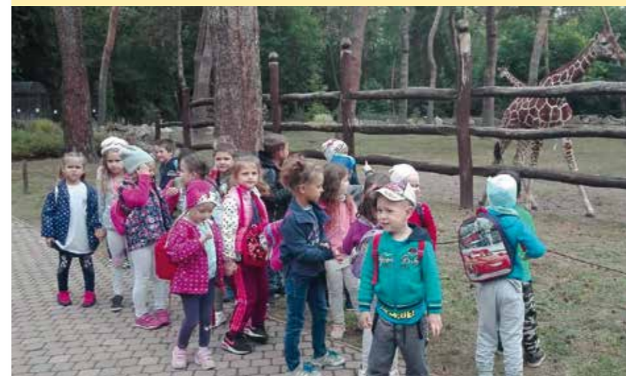
Az állatok világnapján kirándulást szerveztünk. Két csoport a Debreceni Állatkertbe, másik két csoport a Tisza-tavi Ökocentrumba látogatott el.