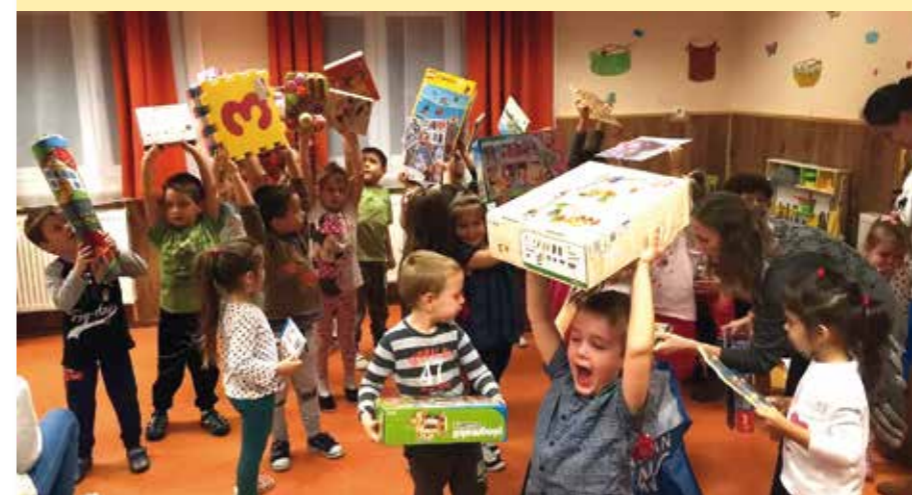
Az Önkormányzat karácsonyi ajándéka, hogy csoportonként 120.000 forint értékben biztosította játékok, fejlesztő eszközök, mesekönyvek vásárlását.