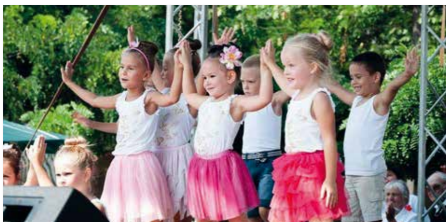
Szeptember első hetében a Pillangó csoport táncosai a Mézfesztiválon szerepeltek.

Szeptember első hetében a Pillangó csoport táncosai a Mézfesztiválon szerepeltek, ahol színvonalas programok várják a település lakóit és minden gyerek számára biztosít ingyenes kikapcsolódási és sportolási lehetőségeket (ugrálóvár, arcfestés, csillámtetkő, elektromos kisautók stb.). Népszerű a főzőverseny, amin óvodánk csapata is részt vett.