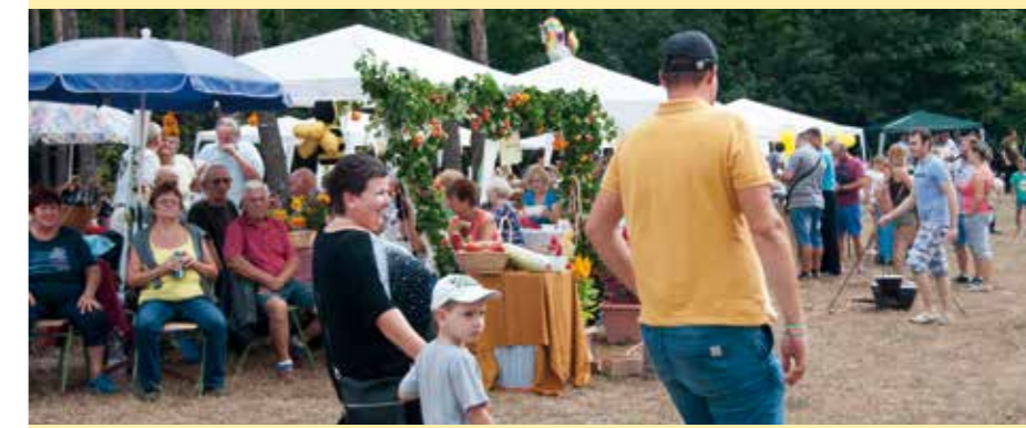
A Mézfesztiválra ebben az évben több mint ezeröttszáz ember látogatott ki.