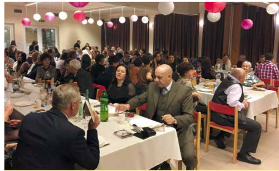
A Márton-napi Jótékonyági Bálon százhusz vendég vett részt. A tombolajegyek bevételét idén is Bocskaiert zöldfelületének növelésére fordítjuk. A tombolatárgyakat a település vállalkozói, civil szervezetei, lakosai ajánlották fel.

Az egészségre nevelés, a sport és a mozgás népszerűsítése volt a célja a szeptember 22-én megrendezett családi sportnapnak. Egyebek mellett futballmérkőzések várták a település lakosságát, még a DVSC öregfiúk csapata is pályára lépett. Egész délután pattogott a labda a műfüvespályán, gyerekek és felnőttek egyformán rúgták a bőrt. A rendezvényen ingyenes szűrővizsgálatokra is lehetőség volt, a gyerekeket pedig ugrálóvár és arcfestés is várta.