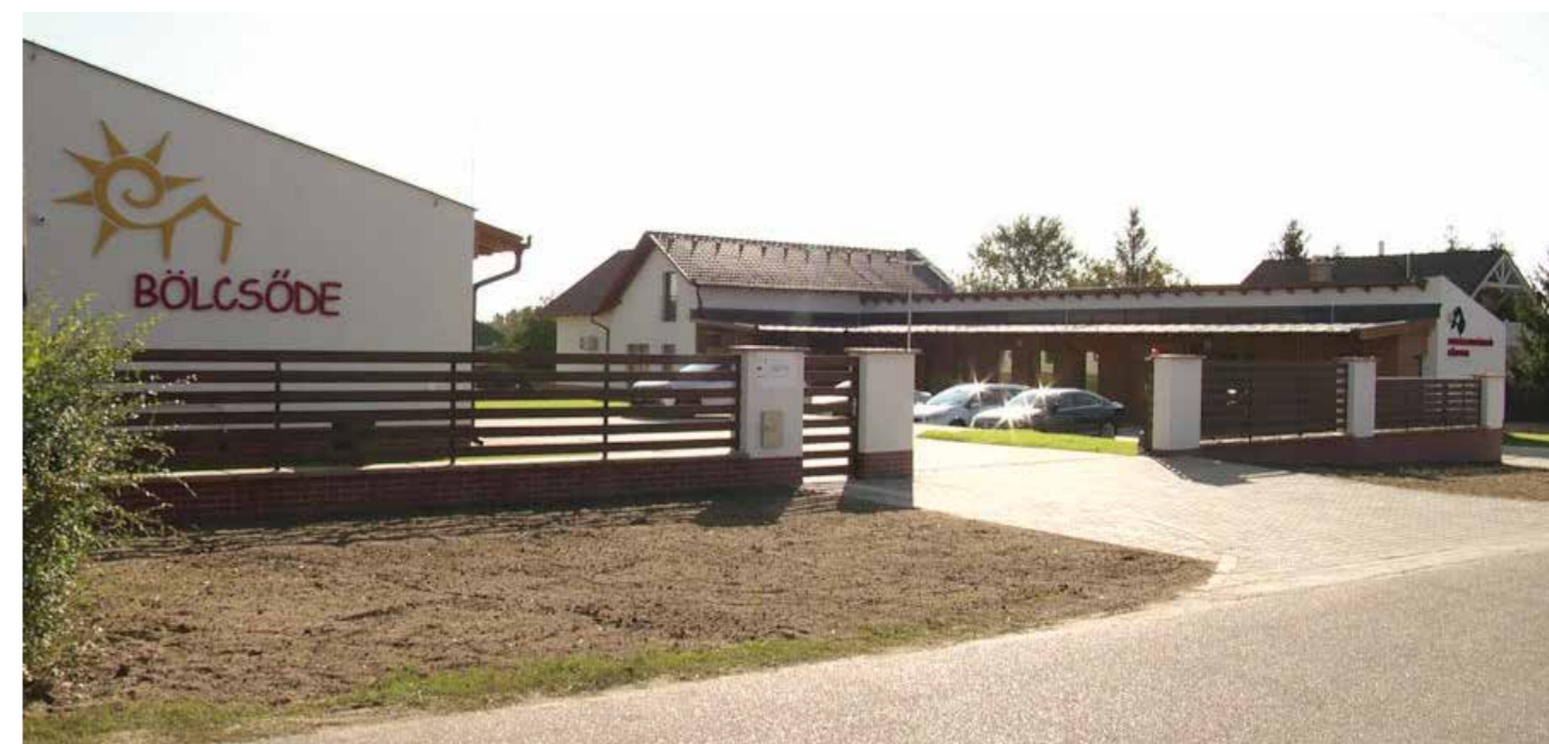
A 2019-es év legjelentősebb beruházása. A Debreceni úton megvalósult fejlesztés eredményeként létrejövő mini bölcsőde újabb férőhelyeket és egy magasabb színvonalú szolgáltatást tesz elérhetővé a családok számára. A Humán Szolgáltató Központ új és korszerű épülete szintén a szolgáltatásokat igénybe vevők színvonalas ellátását segítik.