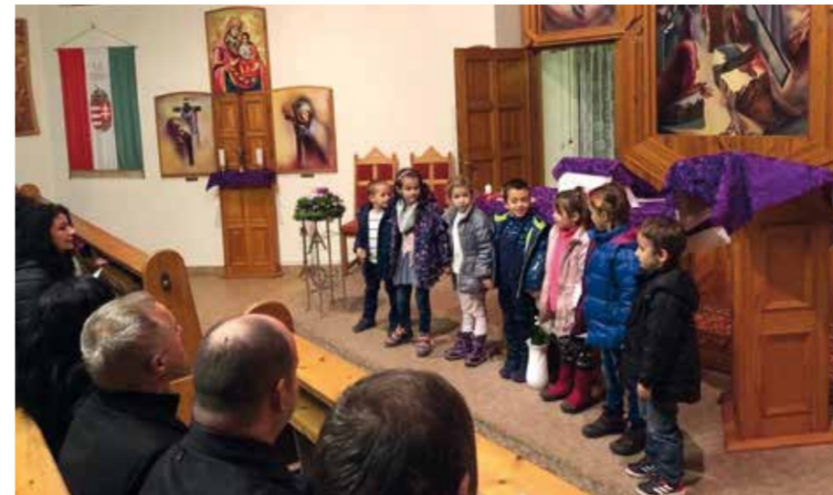
Az adventi ünnepkörben óvodásaink az iskolásokkal együtt karácsonyi ünnepi műsort adnak elő vasárnaponként a templomban.