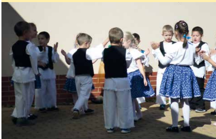
Szeptember végén „Szüreti mulatságra” vártuk az elsősöket, a pedagógusokat és a szülőket. Az ünnepi hangulatról a Gyöngyvirág csoport gondoskodott.