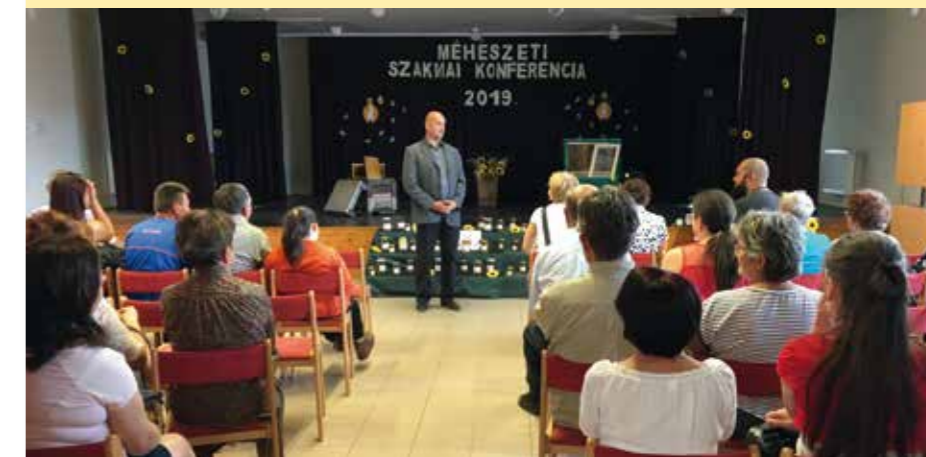
A Méhészeti Szakmai Konferencián előadások hangzottak el, valamint szakmai fórum keretében lehetőség nyílt a szakmai kérdések megbeszélésére, gyakorlati tapasztalatcserére és „jó gyakorlatok” megismerésére.