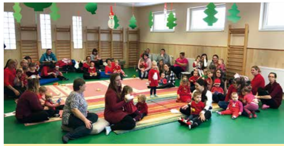
Az ősszel újraindított zenebölcsőben egyre többen vesznek részt.