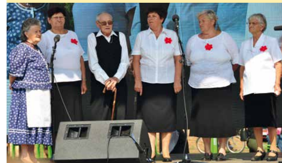
Az Idősek Klubjának tagjaiból álló népdalkör rendszeresen fellép a település rendezvényein.

időben az egészségvédelem és egészségmegőrzés is megvalósul.