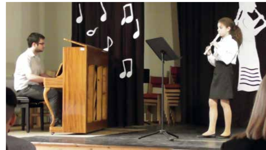
Nagy sikerrel került megrendezésre a kistérségi zenei találkozó, amelyen négy iskola közel 50 tanulója mutatkozott be a hangversenydelutánon. A diákok Bocskaiertből, Hajdúhadházzal, Téglásról és Újfehértóról érkeztek.

nagy sikerrel került megrendezésre a 2019. évi Kistérségi zenei találkozó, ahol négy iskola, közel 50 tanulója mutatkozott be a hangversenydelutánon. A tehetséges diákok – a házigazda, Bocskaierti Németh László Általános Iskola mellett – a hajdúhadházi Földi János Két Tanítási Nyelvű